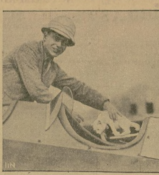
El barón Koenig Warthausen, que va a emprender un viaje en aeroplano alrededor del mundo, no desperdicia detalle para realizarlo con éxito y ha aceptado gustoso la mascota que en forma de gato siamés le han regalado unos admiradores.

Rosebloom-Okun en el Garden en diciembre