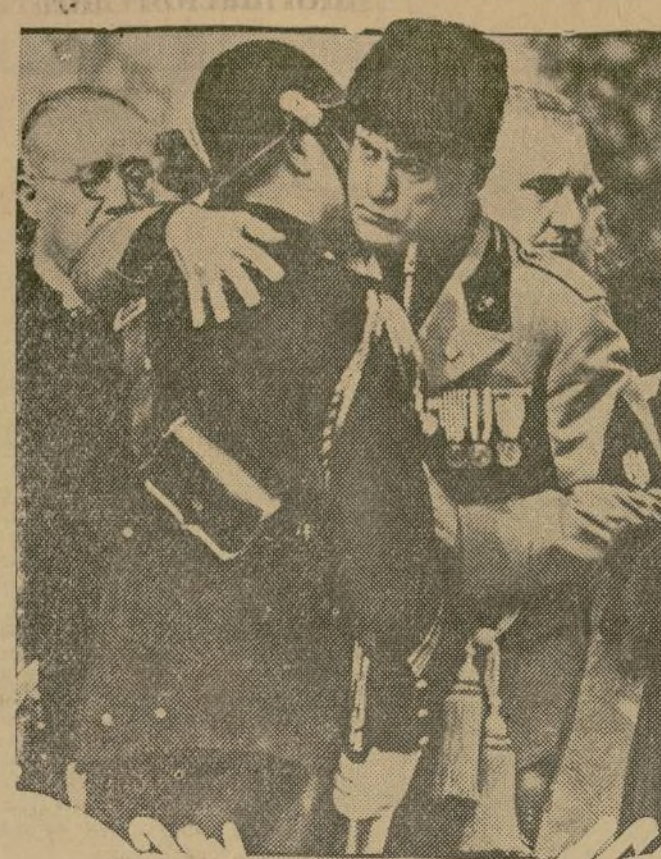
Una de las más recientes fotografías de Mussolini, sorprendido en el momento de recompensar con un abrazo y un beso la hazaña realizada por un policía italiano que expuso su vida en el cumplimiento de su deber.