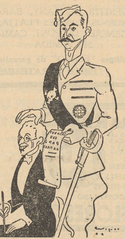
Heus-lo ací. El general faciós, més grotescament trágic, i el fatídic «Botas». Un dia, varen casar llurs fills. Avui casen llur barra. Confiant guanyar, el «cabeçalla» dels traïdors tenia preparats els comptes del «Gran Capitán»

El nostre Govern tindrà ara una representació de la «Unió de Ra-