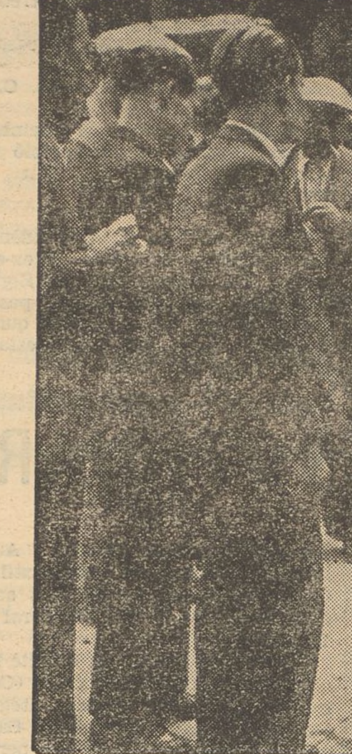
Signe de normalitat a Barcelona és l'animació a les Rambles. El poble les omple a totes hores. I no sols les omple encuriosit per veure el que passa, sinó que hi passeja com de costum i fins s'hi estableixen els venedors ambulants, els «charlatans», els quals donen la nota pintoresca i ensenya de tranquil·litat a la via pública més concorreguda de Barcelona

¿Precedentes? Un solo recuerdo. Fernando VII, en 1823, fué impuesto en el trono contra la voluntad de España, por una intervención de la Santa Alianza, y mediante la venida de los llamados «cient mil hijos de San Luis». Pero Fernando VII no trajo más que franceses reaccionarios. Estaba reservado a los nuevos reaccionarios españoles invadir España con el concurso de moros, con reincidencia, porque esos berberiscos