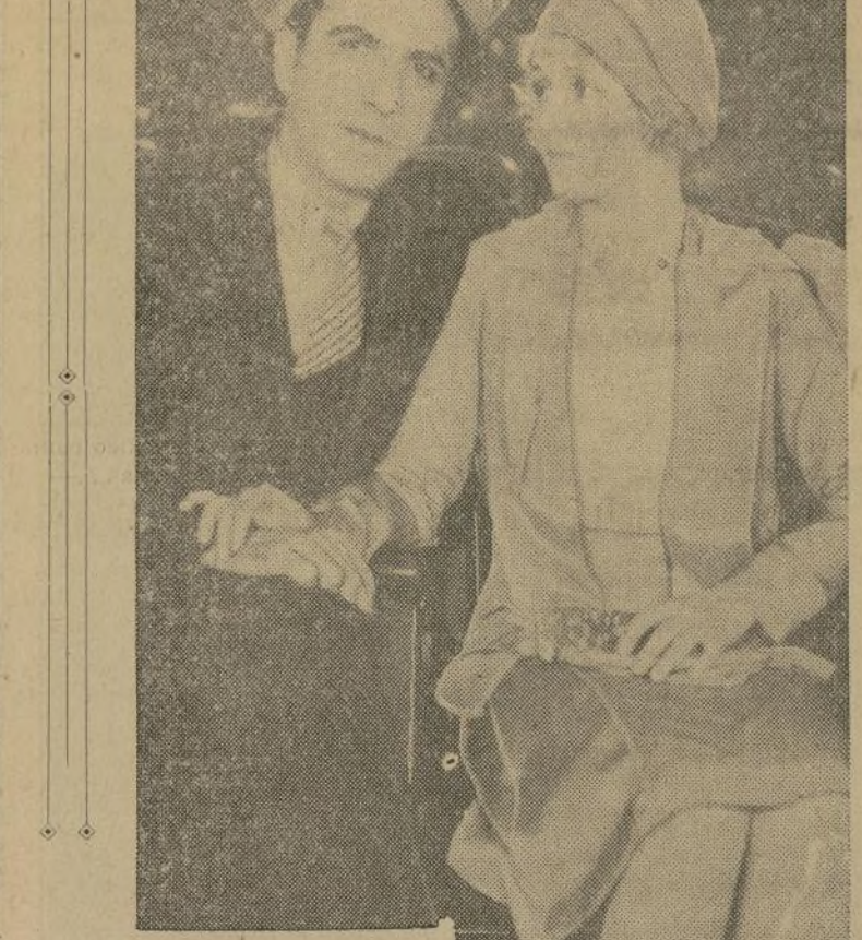
Ted Lewis hace su debut cinematográfico en la obra de Brock Pemberton, "Seven Years Love", en el teatro de Mr. Erlanger.