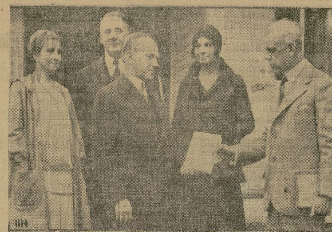
H. C. Kinsley, de Northampton, Mass., en el momento de entregar al presidente Coolidge el primer ejemplar impreso de su autobiografía. El grupo de personas aquí retratadas, entre las que figura la esposa del ex-Pde, están situadas en la entrada de la casa que actualmente habitan los esposos Coolidge.