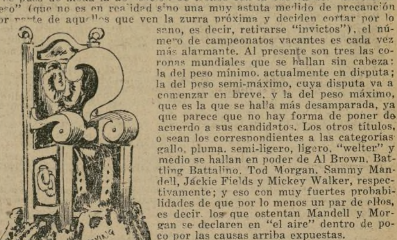
Se necesita un monarca

Desde que empezaron a salir comisiones de boxeo a diestra y siniestra y se puso de moda la abdicación de tronos con la excusa del "exceso de peso" (que no es en realidad sino una muy astuta maniobra de propaganda por parte de aquellos que ven la zorra próxima y desean cortar por lo sano, es decir, retirarse "invictos"), el número de campeonatos vacantes es cada vez más alarmante. Al presente son tres las coronas mundiales que se hallan sin cabeza: la del peso mínimo, actualmente en disputa; la del peso semi-máximo, cuya disputa va a comenzar en breve; la del gran tiempo, que es la que se halla más desamparada, ya que parece que no hay forma de poner de acuerdo a sus candidatos. Los otros títulos, o sean los correspondientes a las categorías gallo, pluma, semi-ligero, ligero, "welter" y medio se hallan en poder de Al Brown, Battalino, Tod Morgan, Johnny Mandell, Jackie Fields y Mickey Walker, respectivamente; y eso con muy fuertes probabilidades de que por lo menos un par de ellos, es decir, los que ostentan Mandell y Morgan se declaren en "el aire" dentro de poco por las causas arriba expuestas.