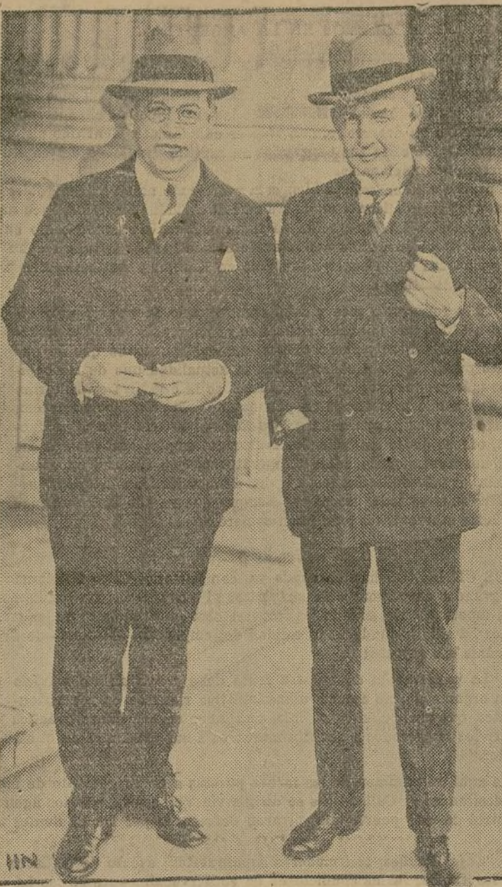
El general Chárlies G. Dawes, embajador de los Estados Unidos ante el corte de St. James y el senador Walter Edge (con lentes) que se espera que será nombrado embajador en Francia para ocupar la vacante que se produjo con el fallecimiento del Hon. Myron G. Herrick.