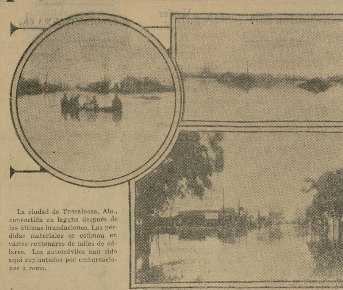
La ciudad de Tuscaloosa, Ala., convertida en laguna después de las últimas inundaciones. Las pérdidas materiales se estiman en varios centenares de miles de dólares. Los automóviles han sido aquí suplantados por embarcaciones a remo.