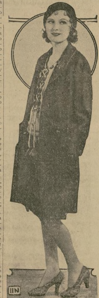
Una de las más atractivas modelos, creación de célebres modistos que lo han presentado en la presentación temporal y que ha sido muy bien recibida por las elegantes.