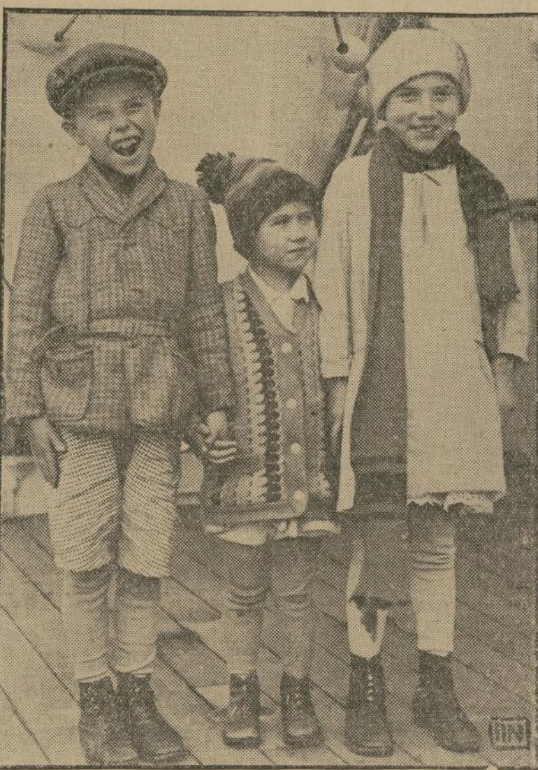
Solos, estos tres niños polacos, hicieron el viaje desde Checoslovaquia a Nueva York a bordo de uno de los grandes transatlánticos que hacen la travesía de Europa. Vienen a los Estados Unidos, a reunirse con su madre, que desde hace algunos años reside en el vecino pueblo de Passaic, New Jersey.