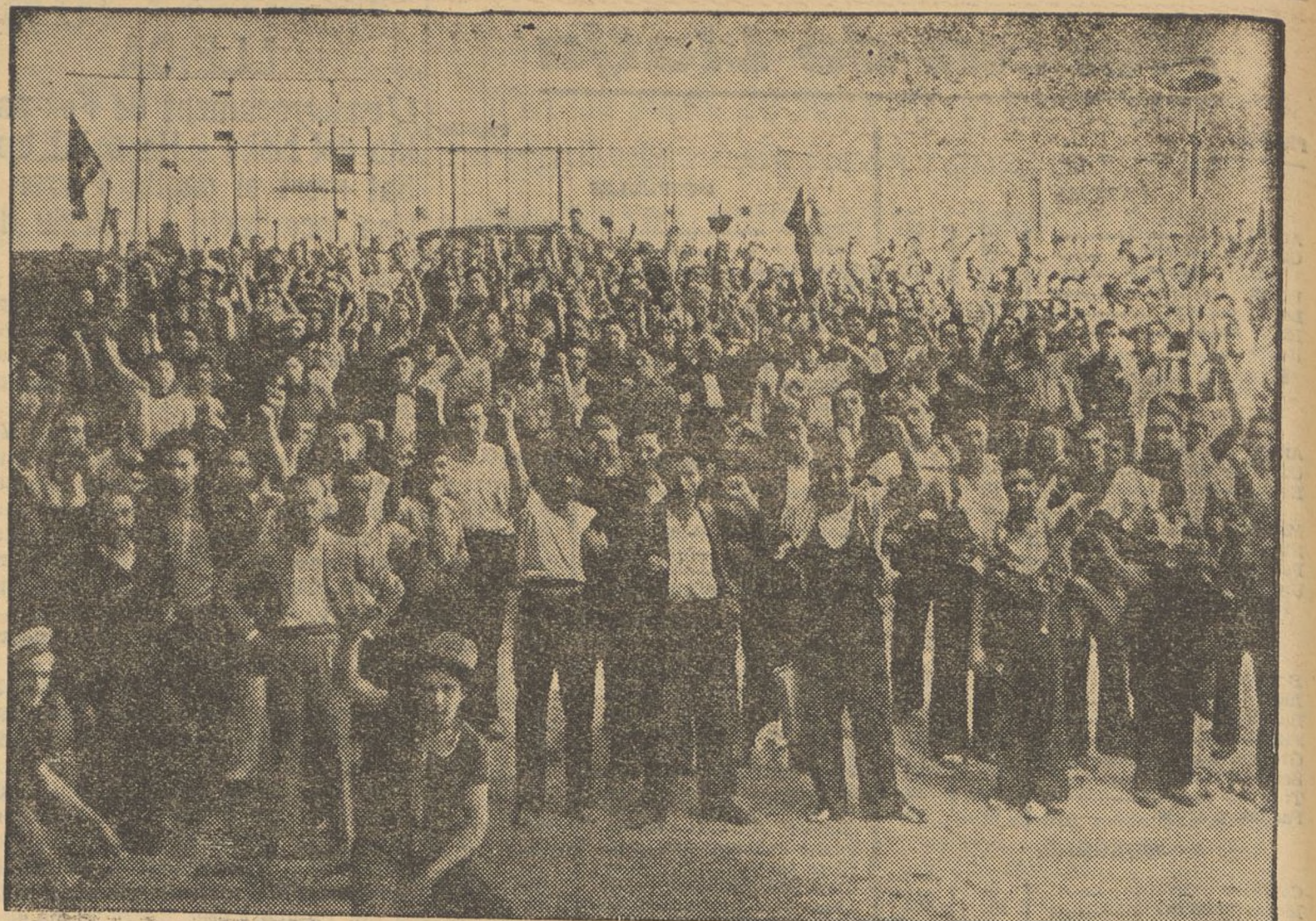
Entusiasme, fe en el triomf, desig de llibertat... El poble respon a la crida per la formació de noves milícies. Vegeu la milícia que marxà cap a Balears