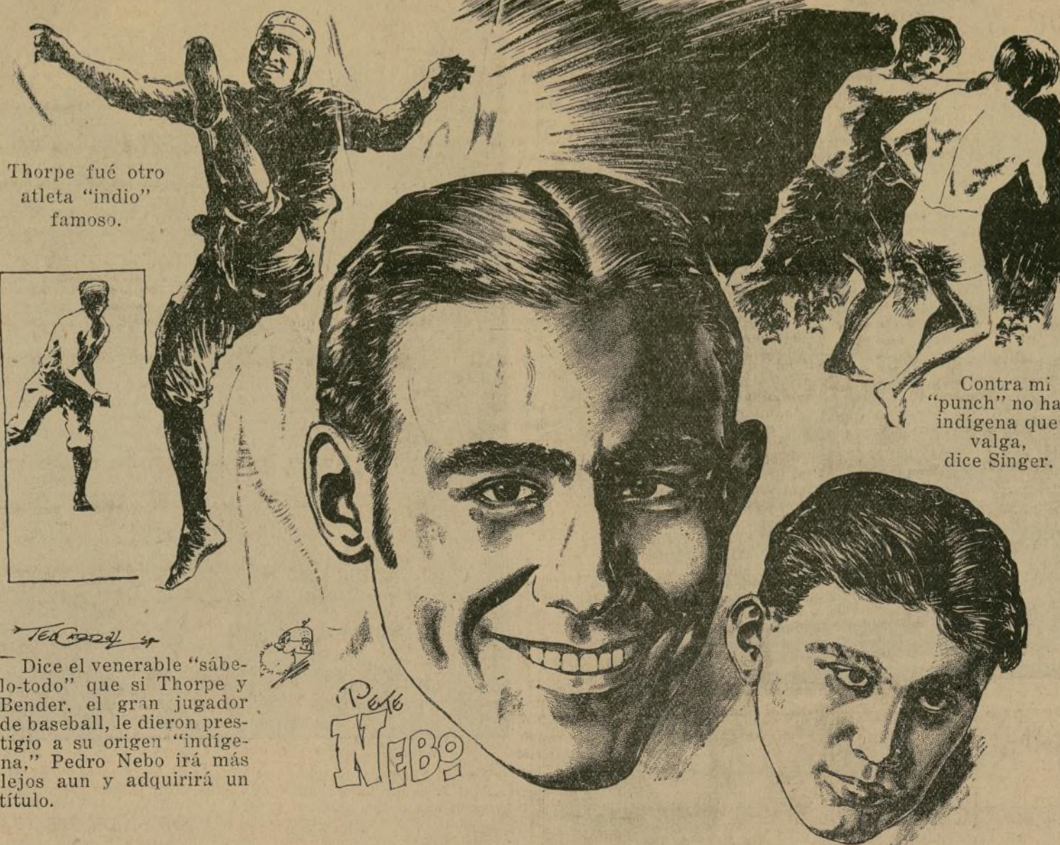
Thorpe fué otro atleta "indio" famoso.

Contra mi "punch" no hay indígena que valga, dice Singer.