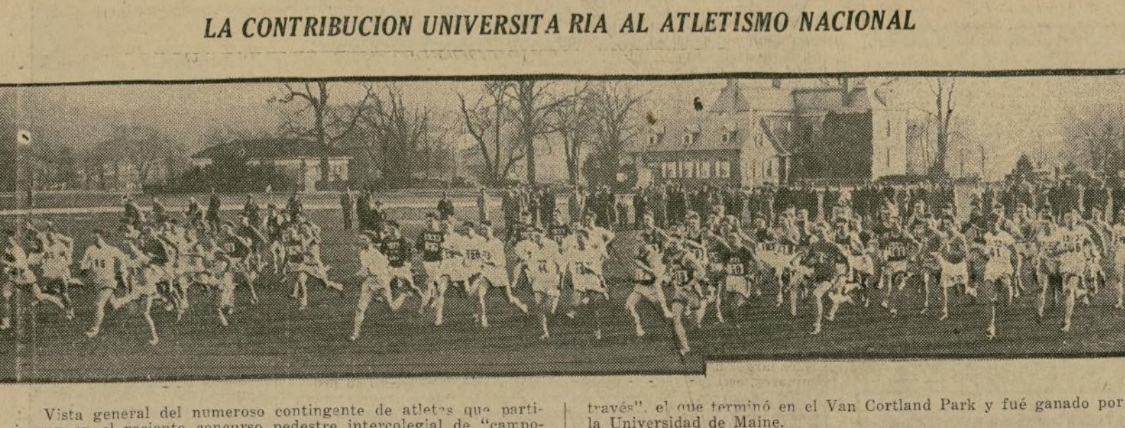
Vista general del numeroso contingente de atletas que participaron en el reciente concurso pedestre intercolegial de "campo-través", el que terminó en el Van Cortlandt Park y fué ganado por la Universidad de Maine.

Después de esto fueron vanas las tentativas de los militares para cambiar el tanteo, pues sus compañeros hicieron una cerrada y respetada defensa.