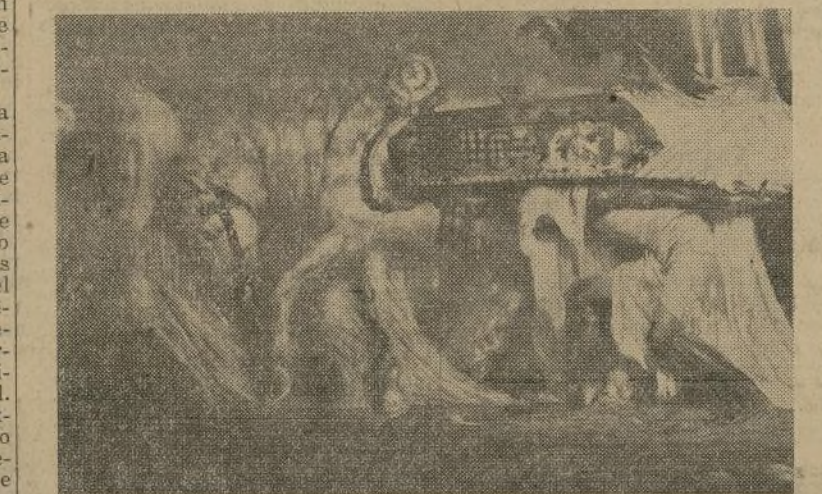
La Marcha Heroica de Beethoven

semanas el pintor y dibujante español José Segrelles, sin duda una de las más intensas y finas personalidades artísticas de su patria. Ercido por el prestigio de sus ilustraciones—sutil y profunda obra