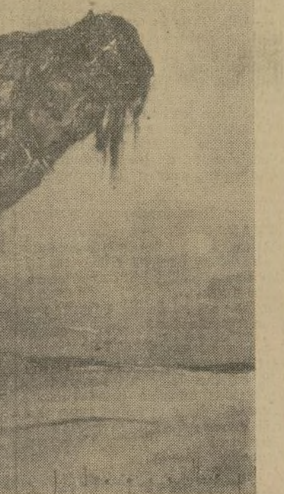
El monumento a la Metamorfosis de Aniel

Esta magna obra está ahora esparcida por el mundo. La gran revista "Illustrated London News" publicó una serie de once ilustraciones sobre temas de Beethoven. Ya había publicado antes siete estampas sobre el Dante. Revistas españolas como "Blanco y Negro" le han dado a conocer al gran público peninsular. Y al llegar aquí "Red Book" encargarle diez ilustraciones para otros tantos poemas originales. "Liberty" y el "American Magazine" tienen ya al artista español entre sus colaboradores. Segrelles, entre este triunfo, se muestra especialmente orgulloso de un gran honor reciente. Su envío a la Exposición Inter-