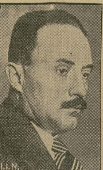
Licenciado don José Vasconcelos

SAN ANTONIO, Texas, diciembre 6. (P).—El licenciado don José Vasconcelos, derrotado candidato antirreelecciónista a la presidencia de México, hizo un llamamiento a las armas a sus partidarios.