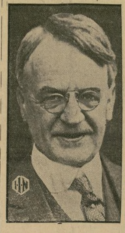
Embajador Dwight W. Morrow

El embajador de EE. UU. en Méjico arriba a Nueva York El embajador de EE. UU. en Méjico arriba a Nueva York