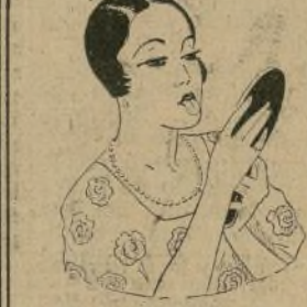
Vigile su lengua. Esto refleja la condición de su estómago.

El embajador declaró que probablemente irá hoy a Nueva York para verse con el ex-presidente Calles de México, que debe llegar de Europa. Sus planes futuros dependen del curso de los acontecimientos después de la conferencia de armamentos.