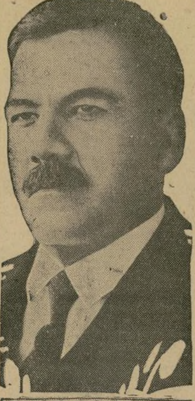
Gen. E. Calles

LA PRENSA. Esta extensa y sensacional información a la página contribuyendo así, en su esfera, a que llegue a todos la apelación tan dramática y tan intencionada, del gobernador de Puerto Rico.