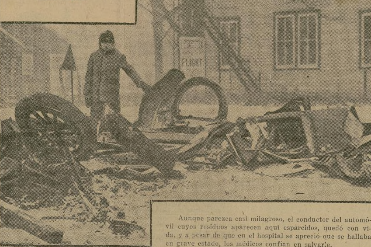
Aunque parezca casi milagroso, el conductor del automóvil cuyos residuos aparecen aquí esparcidos, quedó con vida, y a pesar de que en el hospital se apreció que se hallaba en grave estado, los médicos confían en salvarle.

...Y EL CHAUFFEUR, AUNQUE NO ILESO, QUEDO CON VIDA