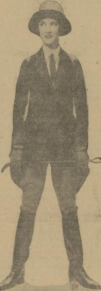
Las estrellas de la colonia gelatinosa de Hollywood, se han aficionadas a la equitación, habiendo ideado nuevos y atractivos trajes para llevarlos a caballo. El modelo que aquí se presenta, es uno de los que más éxito han tenido.