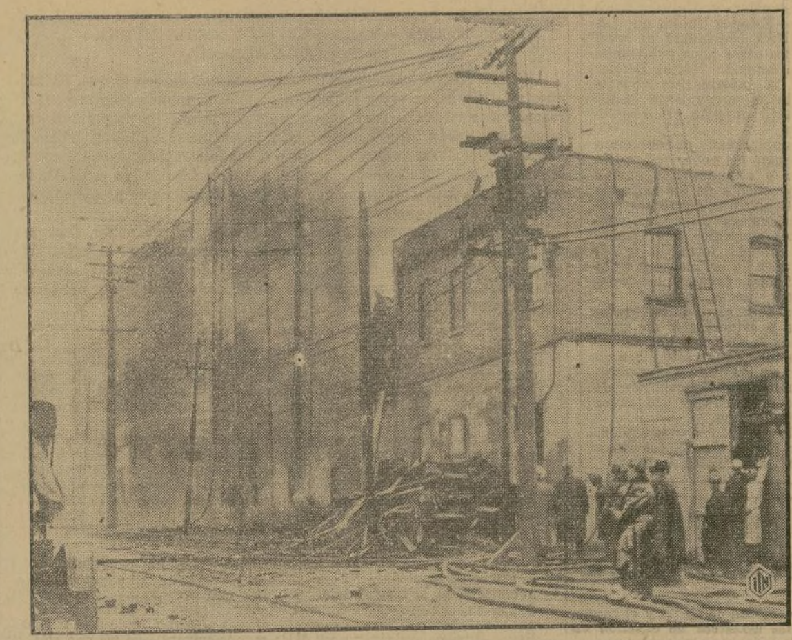
En una fábrica de hielo de Cincinnati, Ohio, se declaró un incendio que costó la vida a cuatro bomberos, que perecieron al derribarse una de las paredes. Las llamas se enseñorearon del edificio durante 48 horas.