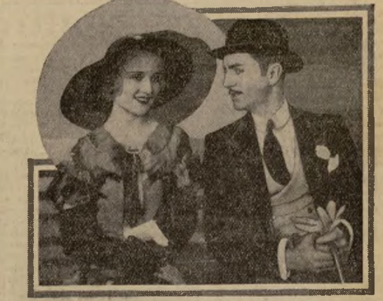
El elegante William Powell y la encantadora Carol Lombard en una escena de su cinta "Man of the World", que empieza a proyectarse sobre el lienzo del "Fox Star" el sábado.

Las funciones serán dobles y a precios populares.