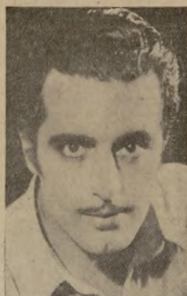
Fortunio Bonanova, actor español que en "The Silent Witness", la obra de misterio que se representa en el "Morosco", repite el triunfo alcanzado en "The Dishonored Lady".

Para romper la monotonía de las comedias que las empresas cinematográficas han venido lanzando al mercado, donde todas las gracias las pintan los humanos, Columbia ha tenido una idea: va a comenzar una serie de comedias, bien hilvanadas y llenas de situaciones pletóricas de hilaridad, en las cuales solamente intervengan animales irracionales.