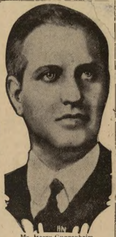
Mr. Harry Guggenheim

HABANA, 2 abril.—(A). El embajador de los Estados Unidos, señor Harry P. Guggenheim, hizo hoy unas declaraciones negando de un modo enfático las informaciones dadas a conocer por algunos diarios de que el estaba actuando como "intermediario u observador" en las conferencias que el gobierno cubano y el partido de la oposición.