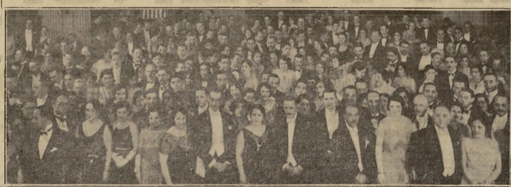
Imponente aspecto del gran baile del Comité Colombiano de Beneficencia celebrado el sábado pasado en el salón "Cherry" y al que concurrió una nutrida y selecta representación de las colonias de habla española y en particular de la colombiana.