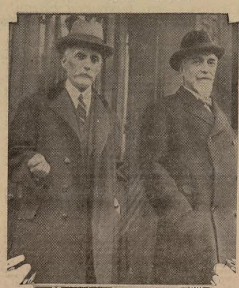
Fotografía del secretario del Tesoro de los Estados Unidos Mr. Andrew W. Mellon (izquierda) y Mr. Montagu C. Norman, gobernador del Banco de Inglaterra, durante la visita que este hizo recientemente al primer ministro en sus oficinas de Washington, D. C. No hay quien duela de que ambos caballeros estén acostumbrados a manejar muchos millones.