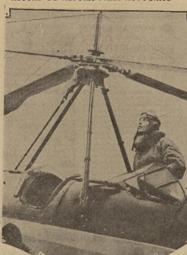
La conocida aviadora Amelia Earhart fotografiada al lado de su autogiro en el cual se elevó recientemente en Filadelfia, alcanzando la altura de 18,500 pies, siendo esta la mayor elevación que se haya alcanzado con aparatos de esa clase, que como es sabido, fueron inventados por el ingeniero español La Cierva.