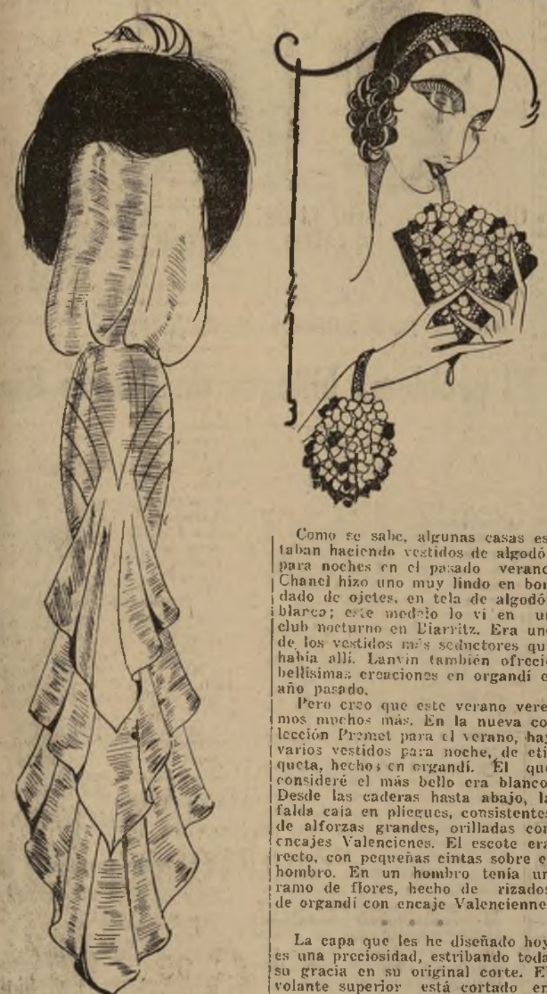
Preciosa capa de noche, con volantes incrustados

PARIS, abril 6.—Para las noches de verano, las telas de algodón ocupan un lugar conspicuo entre las sedas los rasos. ¿Y por qué? Las nuevas telas de algodón no solamente tienen apariencia de seda, sino que es mucho más fresco en realidad que la seda. Además, no podemos continuar considerando los materiales de algodón como económicos, porque los más importantes fabricantes de tejidos se están interesando en ellos y los hacen todo menos baratos. ¿Qué hay más apropiado para un vestido de baile en el verano, que el organdi de algodón, fresco y frágil? Ya escogió usted un vestido de seda, para noche, como lo dice, pues lo he visto en delicadas tonalidades pastel y en blanco.