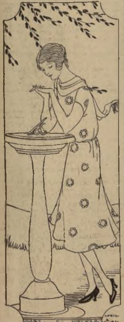
La mujer debe ser toda dulzura y comprensión.

Ha sido costumbre antigua de las grandes casas de la nobleza, poseer una divisa que sea síntesis del ideal de la familia. Estas divisas in-