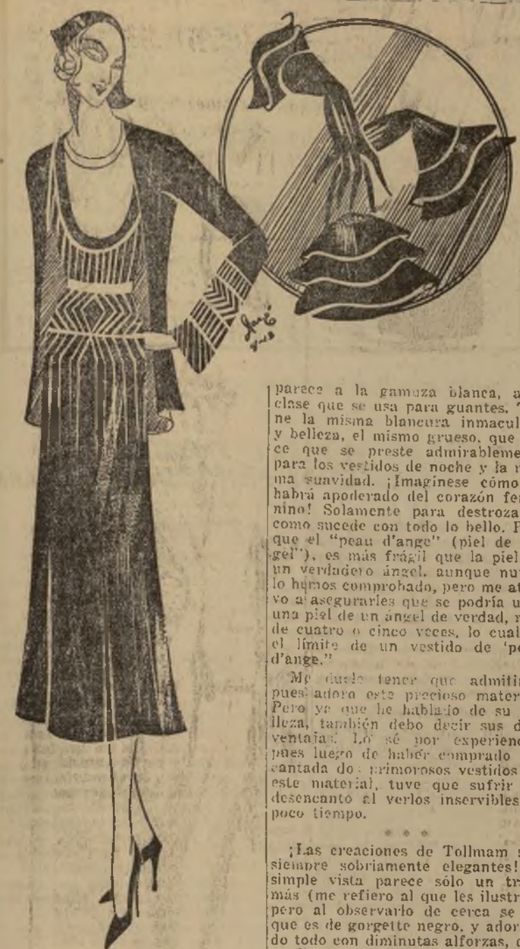
Traje de primavera en georgette negro con adornos blancos

A bordo del S. S. "Le de France", abril 8. — Las cosas bellas por lo regular no son útiles y quizás en el fondo del alma deseamos que no lo sean. Los guantes de cabritilla blanca, flores artificiales usadas para adornar, terciopelo y ahora el "pea d'ange", se conservan en el corazón femenino y en las mentes masculinas como algo muy lindo y muy frágil.