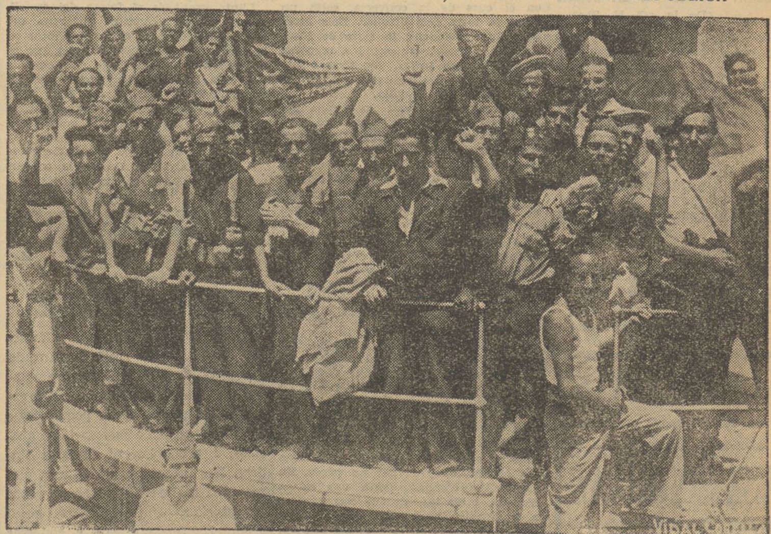
Milícies ciutadanes disposades a la lluita contra els enemics de la República Democràtica, embarcades en un vaixell de guerra que els traslladarà al lloc en el qual entaularan nou combat, seguit indefectiblement de la victòria, contra militars traïdors, capellans perjurs i feixistes repugnants que pretenien en rara amalgama apoderar-se de la República que el poble es donà per a convertir-la en un feu de les seves concupiscències.