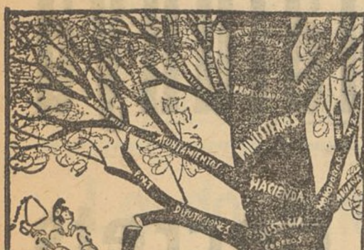
NOTAS DE AGRICULTURA —Sin esperar al otoño, ¿se ha adelantado el tiempo de la poda? (De «Heraldo de Madrid»)