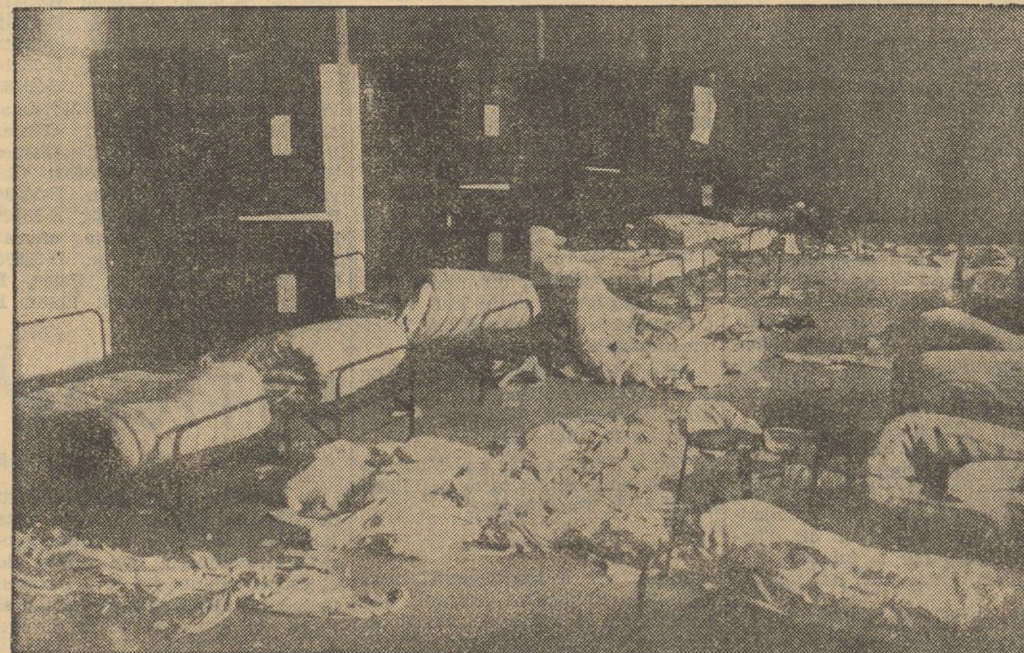
La caserna d'Artilleria de St. Andreu es comptava entre les sublevades i a la qual va lluitar-se un dels més aferrissats combats per a reduir-la. Els impactes que es veuen a la paret donen idea de l'intensitat del tiroteig. Del desordre que es produí a l'interior, el dormitori de les tropes n'és una prova. Finalment, els traidors tractaren de fugir, disfressant-se de persones decentes. Hous aquí la roba d'uniforme que es deixava un que fou detingut en camí.