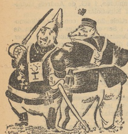
LOS GENERALES FACCIOSOS NO DEBEN MORIR EN LA CAMA (De la «C. N. T.»)