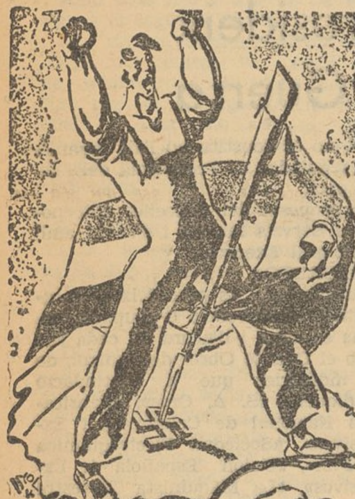
EL TRIUNFO DE LA DEMOCRACIA (Del «Mundo Obrero»)