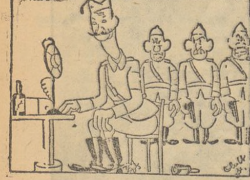
ALO, ALO... —Aquí, radio Sevilla... ¡Me parece que me he caído con todo el Queipo! (De «La Libertad»)