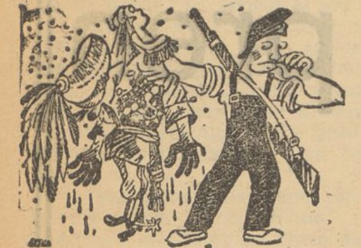
—Després de perdre totes les colònies d'Espanya, volien perdre Espanya per mitjà d'una colònia! (De «La Publicitat»)