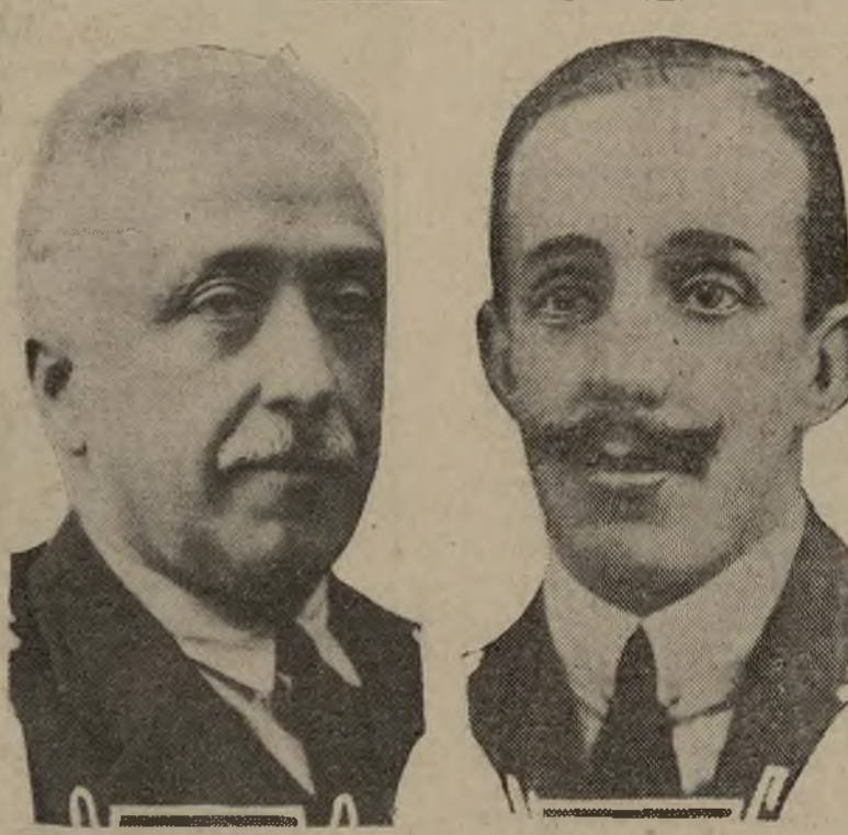
Don Niceto Alcalá Zamora