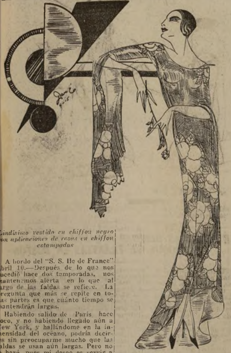
Unidísimo vestido en chiffon negro con aplicaciones de resaca en chiffon estampadas

A bordo del "S. S. Ile de France" abril 10.—Después de lo que nos sucedió hace dos temporadas, nos mantenemos alerta en lo que al largo de las falda se refiere. La pregunta que más se repite en todas partes es que cuánto tiempo se mantendrán largas.