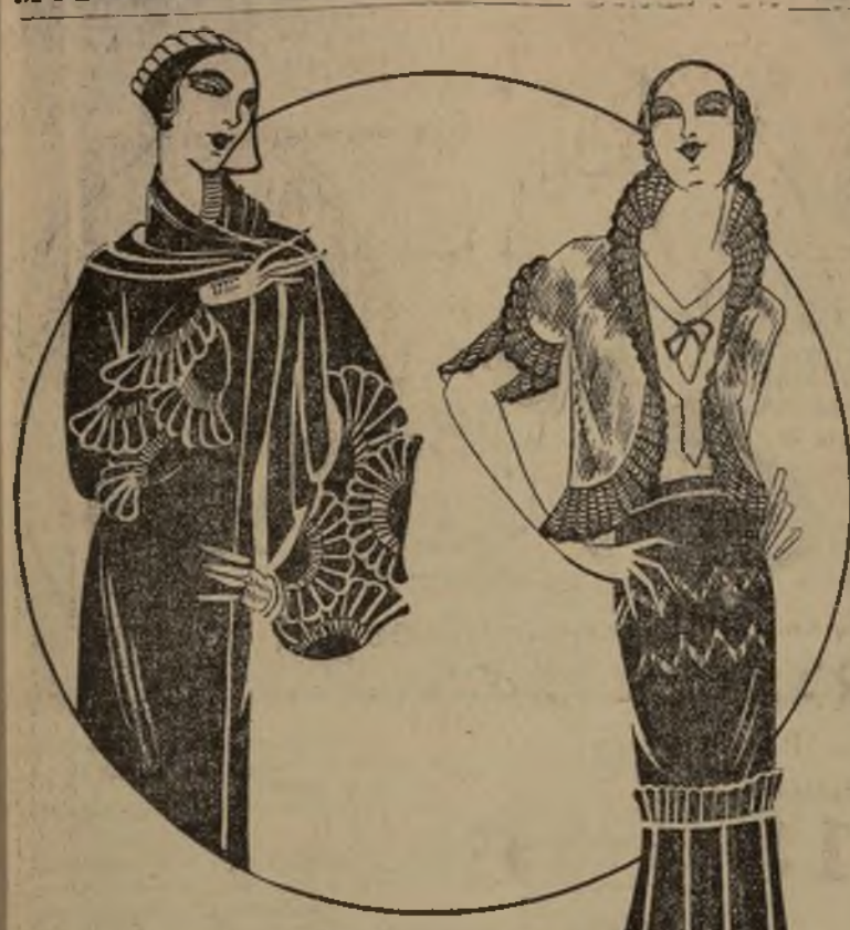
Conjunto de primavera en surta liviana con bonitos pliegues

Hoy a las diez de la mañana y en la iglesia de la medalla milagrosa, se celebrará misa y respuestas en su (sigue en la 2a. pág.)