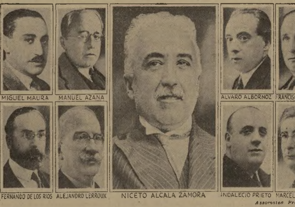
Don Niceto Alcalá Zamora, presidente del gobierno republicano provisional de España, rodeado de los miembros de su gabinete.