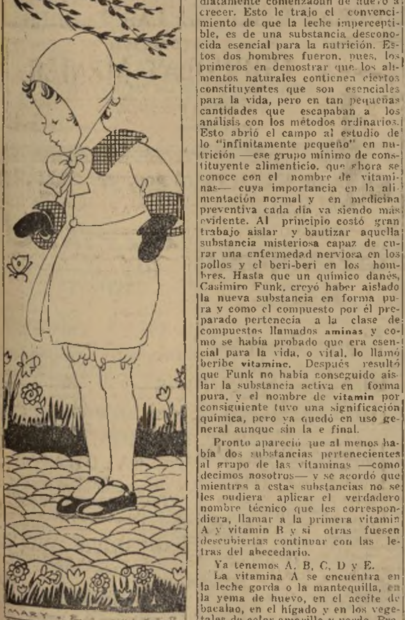
Una alimentación bien balanceada, constituye un problema de importancia en la salud de los niños