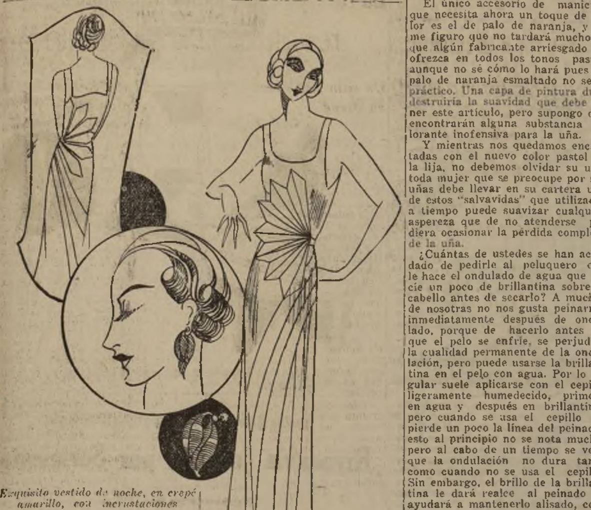
Exquisito vestido de noche, en crepe amarillo, con incrustaciones

MODAS DE PARIS Por Mlle. DARE CHARLAS DE BELLEZA