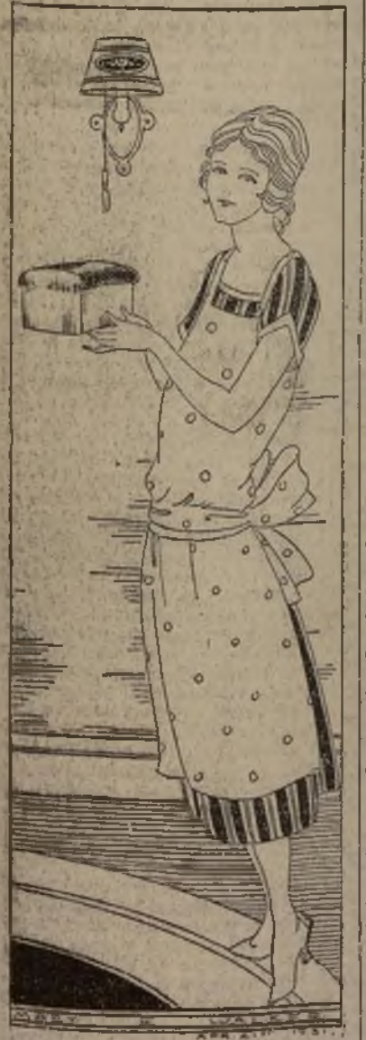
El pan es complemento indispensable, y hecho en la casa en más sabroso aún.

Huevos florentinos Pasarse por agua con sal seis huevos, según el método habitual. Secarlos bien y ponerlos en una fuente que pueda ponerse al horno, adornada en el fondo con ramitas