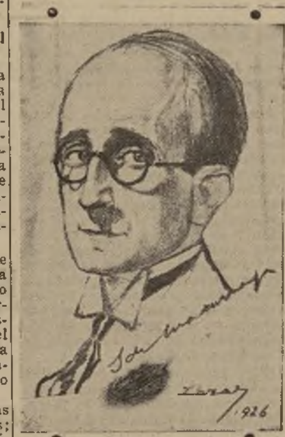
Don Salvador de Madariaga, eminente filósofo, escritor de nota y autorizado internacionalista de reputación mundial, que acaba de ser designado para el puesto de embajador en Washington por el gobierno republicano de Madrid.