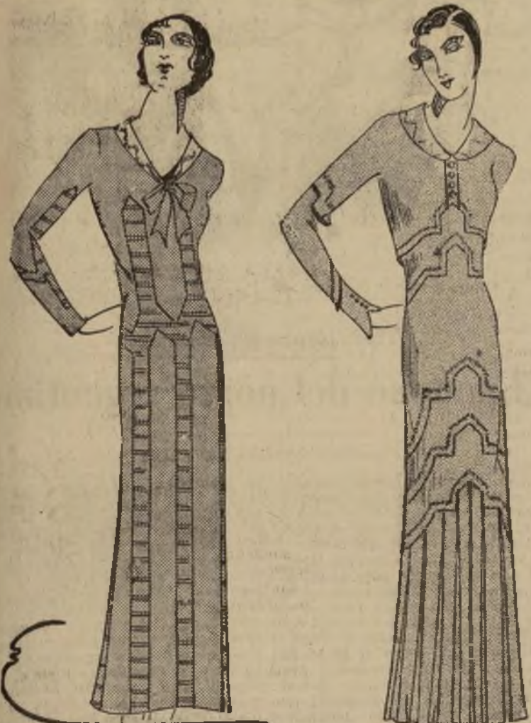
Encontrado vestido de tarde en tusor azul con chaqueta corta y otro vestido de tussor rosa con chaqueta de tres cuartos

NEW YORK, abril 22.—Diariamente recibimos cartas haciéndome diversas preguntas. Una de ellas es si las encantadoras pijamas de noche continuarán usándose tal como si fuesen vestidos. ¡Estoy segura que varias de mis lectoras desearán saber algo de esto!