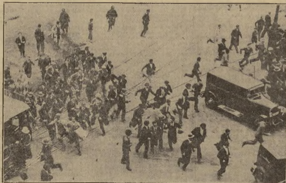
La policía de Madrid dispersando a grupos de republicanos que el día de las recientes elecciones formaron numerosas manifestaciones celebrando el triunfo de sus ideales. Dos días después de celebrarse los comicios el rey Alfonso se veía obligado a abandonar a España y los republicanos, antes perseguidos, ascendían al poder.