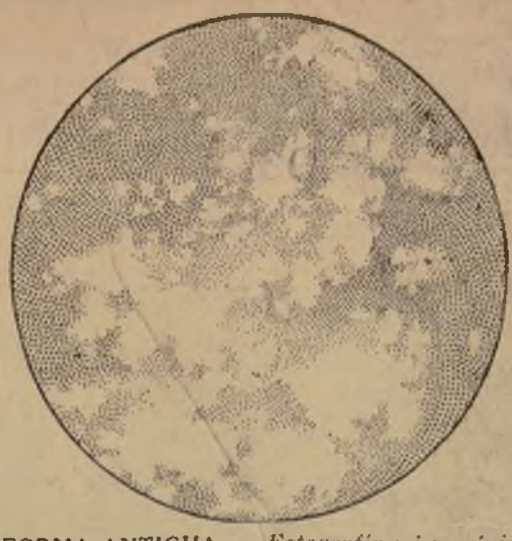
LA FORMA ANTIGUA... Fotografía microscópica del Mantecado congelado por medio del antiguo y lento procedimiento de refrigeración, demostrando los carámbanos de gran tamaño que resultan de la congelación lenta.