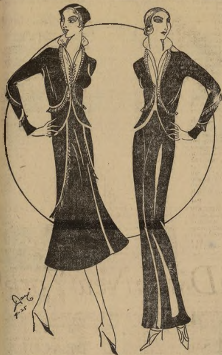
Bañito traje de primavera de cuatro piezas y pijama

NEW YORK, abril 24.—No importa lo que se diga, pero, siempre habra que llegar a la conclusión de dividir las faldas de las pijamas. El uso de las pijamas para algo más que para dormir, es algo que al fin y al cabo la cautivará, por más que se resista. Quizás no tenga pijamas para noche, ni tenga tiempo para ellas en su hogar, pero de alguna forma hallará usted el medio de usar pijamas tarde o temprano.