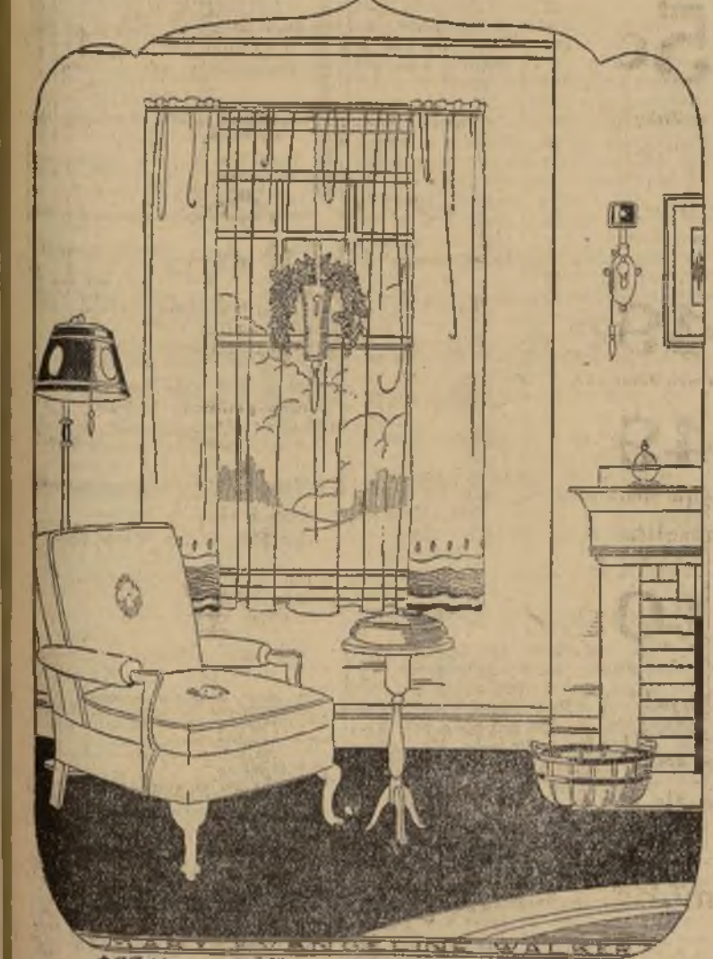
Ventana lindamente adornada

porcionarán la deseada nota de verdor. Las ventanas que no tienen ninguna vista, pues ésta está interceptada por otros edificios, úsese una