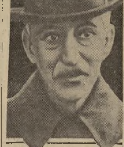
Don Francisco Maciá

Confundiendo triunfar en las elecciones se están organizando en toda España