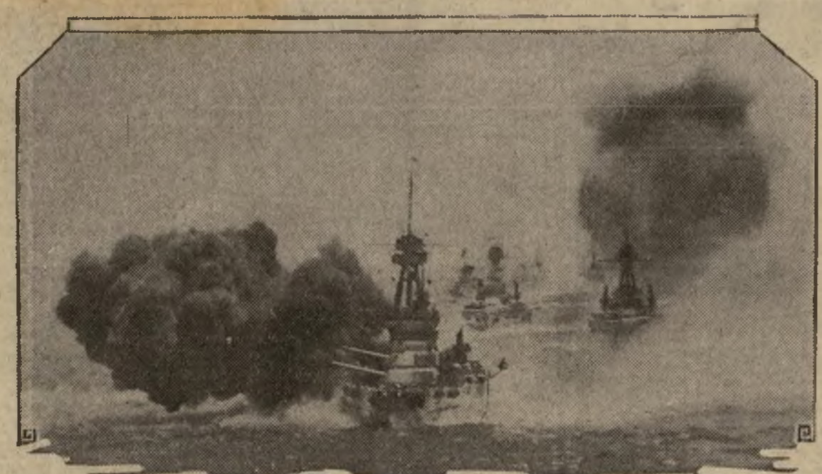
Un grupo de acorazados de la escuadra americana del Pacifico, encabezados por el buque almirante "New York", haciendo ejercicios de puntería con los cañones de 14 y 16 pulgadas durante las maniobras en las costas de California.