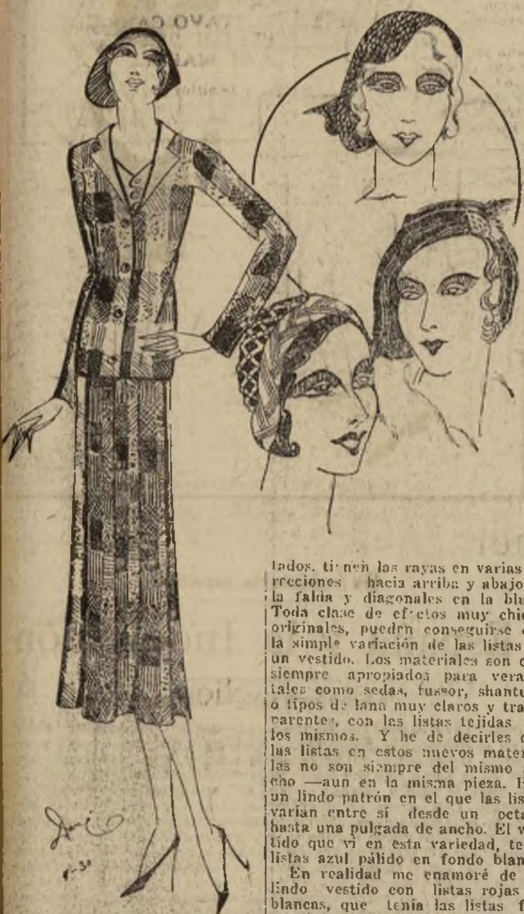
legante "tailleur" a cuadros rojos y blancos con blusa de lana transparente en color beige

LOS ANUNCIOS EN "LA PRENSA" PRODUCEN RESULTADOS RAPIDOS Y SATISFACTORIOS