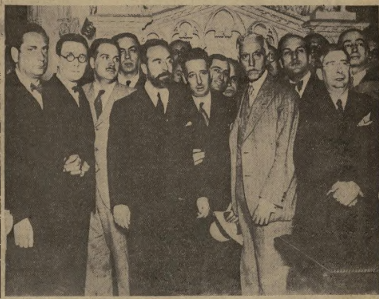
Durante las negociaciones entre el gobierno republicano de Madrid y la Generalidad de Cataluña, tres ministros del gabinete del presidente Alcalá Zamora—los señores de los Ríos, Domínguez y Nolasco—se trasladaron a Barcelona, donde les presenta el grabado, rodeando al señor Maciá, jefe del movimiento catalán.