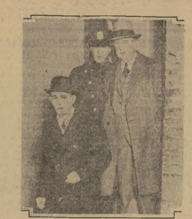
Diamond entregándose a la justicia