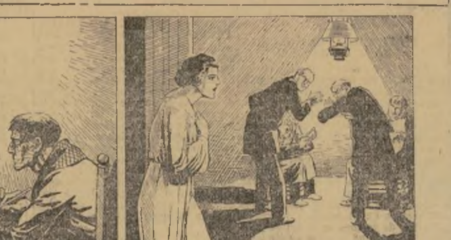
—Cinco minutos más...