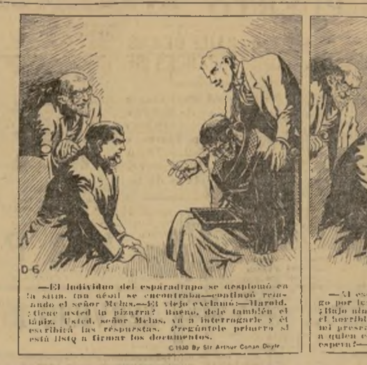
—El individuo del escapulario se despojó en su sitio, por lo cual se descubrió...