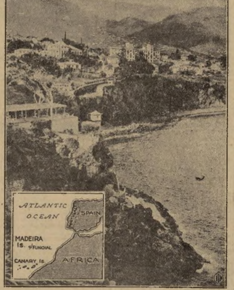
El grave estado de cosas hace esperar un nuevo choque de rebeldes y fuerzas del gobierno en Funchal, donde las unidades navales han desembarcado ya tropas leales.