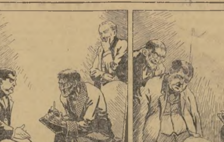
—De pronto se me ocurrió un detalle...