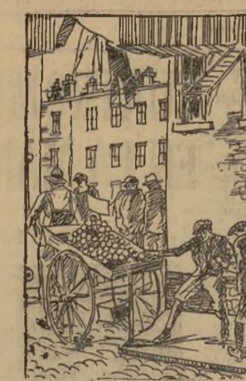
Principios del delincuente