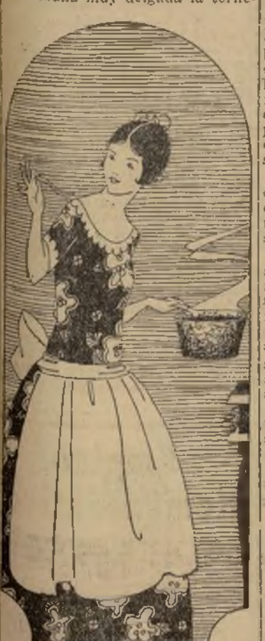
Preparando el menú, alegre y dispuesto.