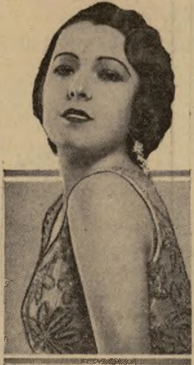
La encantadora Lupita Tovar en la magnífica producción, toda hablada en español, "Carne de Canibal", que empieza a exhibirse en el "San José" el próximo viernes.

Se nos informa por la empresa que no se está omitiendo esfuerzo ni escatimando gastos para hacer de la apertura un verdadero acontecimiento. El teatro ha sido caprichosamente decorado con motivos hispanos y dispondrá de los últimos adelantos en cuanto a confort y elegancia.