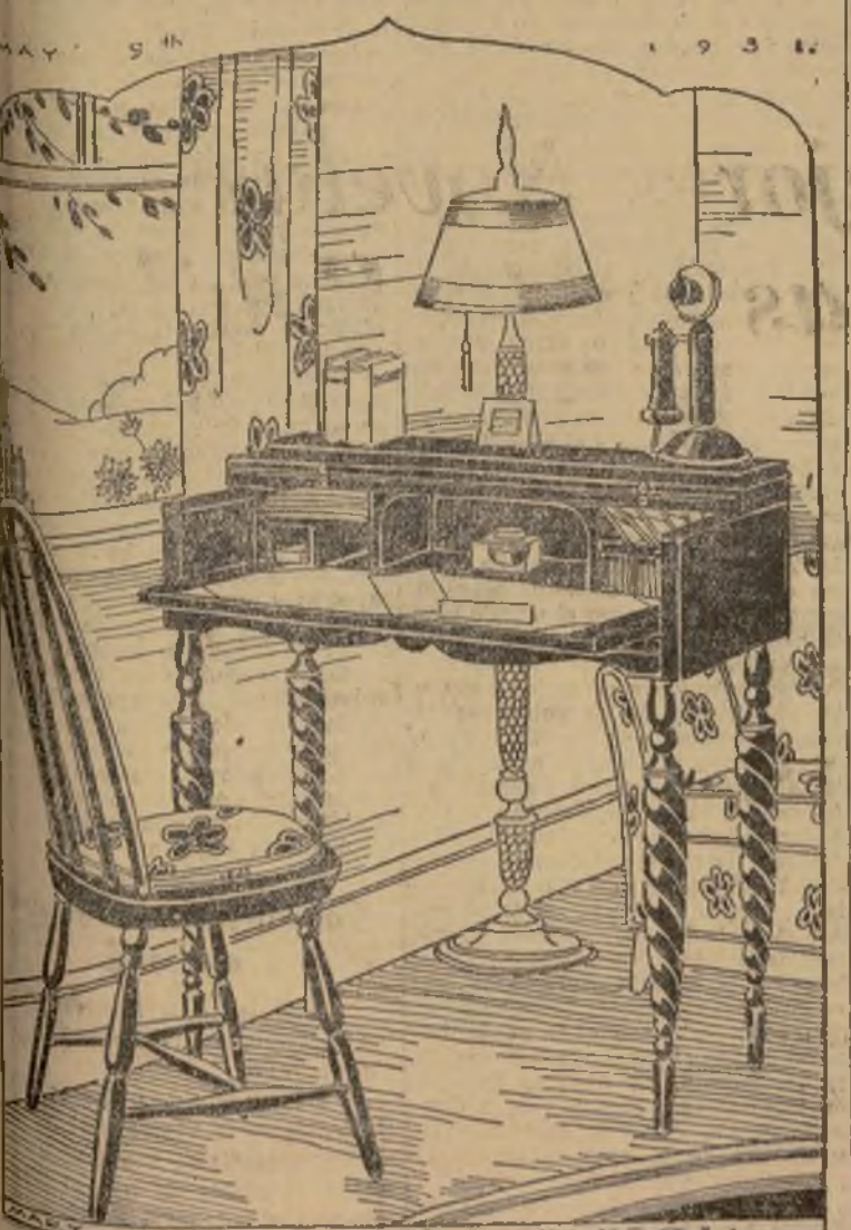
Bonito escritorio estilo clavicordio.

La selección de un escritorio es cuestión de importancia. Debe de satisfacer las necesidades de su poseedor, además aversarse con la decoración general de la habitación donde se colocarse. Afortunadamente describimos hoy son históricos, aunque se adaptan a las conveniencias modernas de un modo maravilloso. El escritorio llamado del "Gobernador Winthrop" con sus muchas