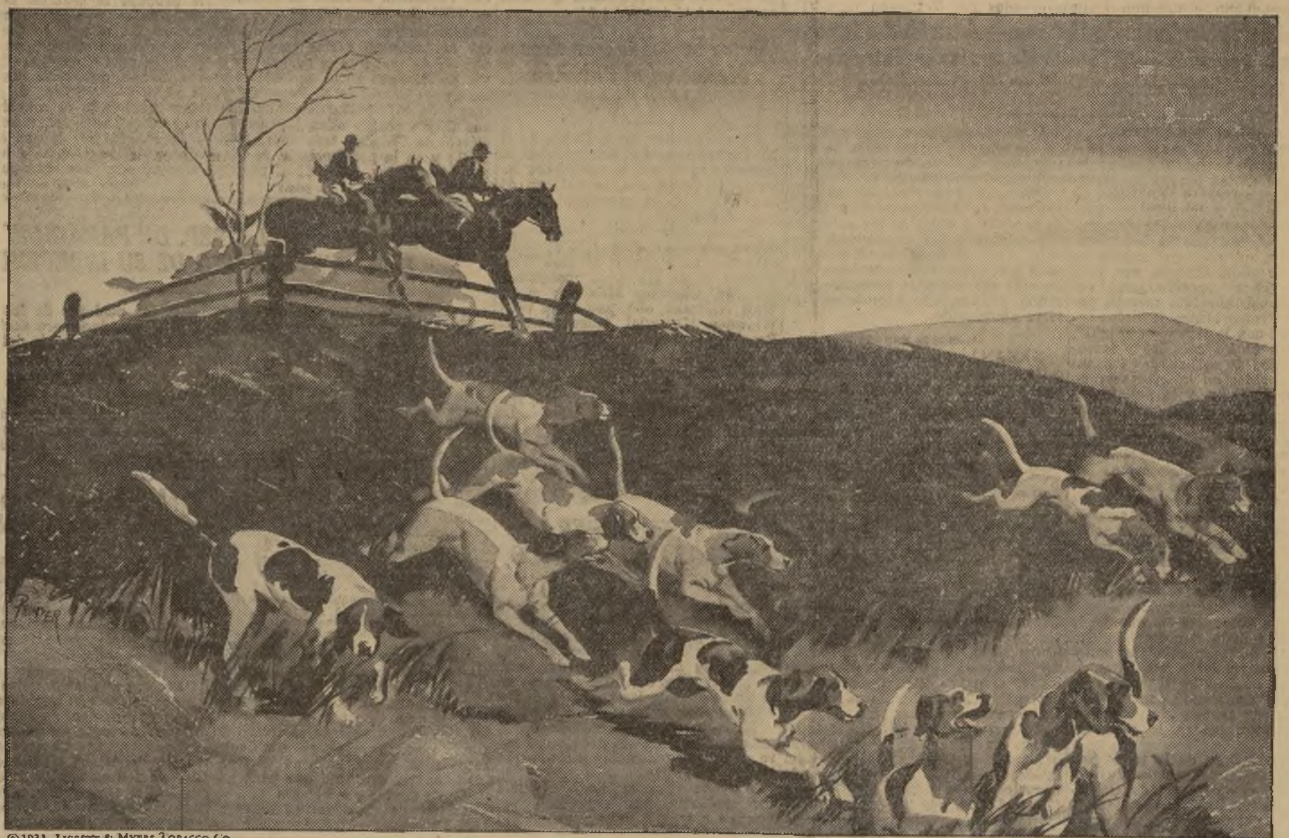
© 1931, LIGGETT & MYERS TOBACCO CO.