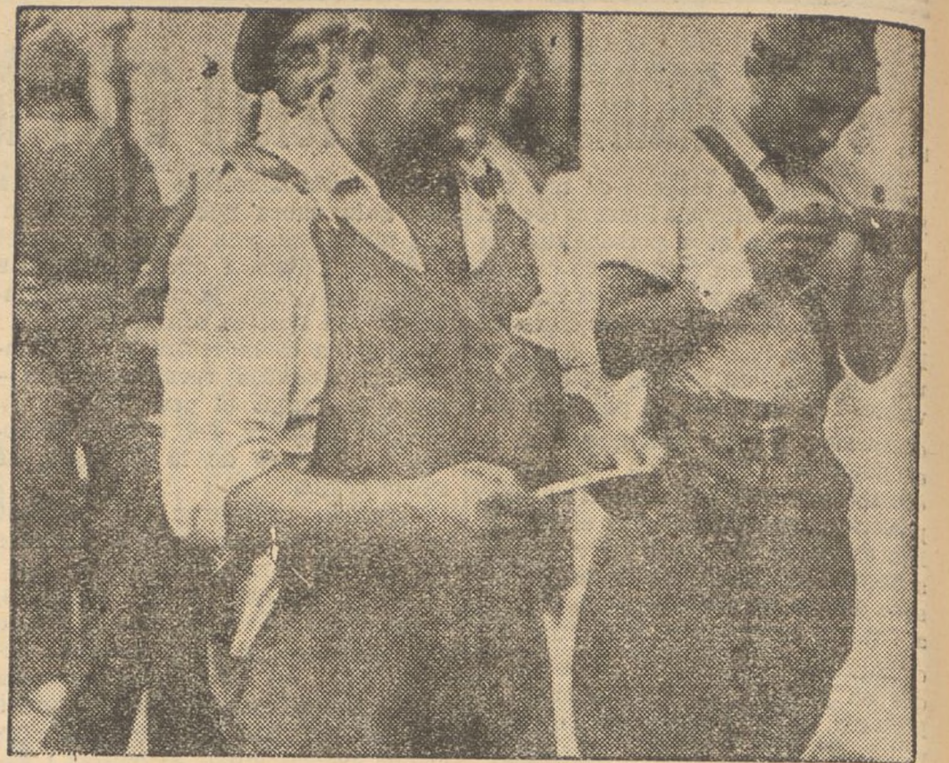
El carter és el millor amic dels milicians. Tots l'esperen ansiosament i quan arriba, l'ajuden a distribuir la correspondència. Com són esperades les noves que arriben per conducte de la carta familiar que parla de tendres enemics de la lluita afeïssada.