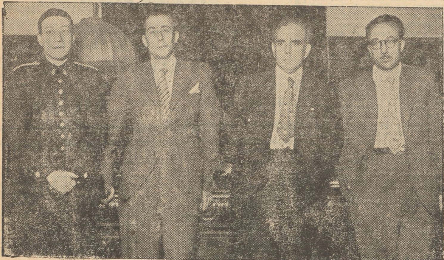
Tingué lloc ahir l'acte de la presa de possessió del nou comissari general d'Ordre Públic de Catalunya, comandant Gómez García, nomenat per dimissió del senyor Escofet.