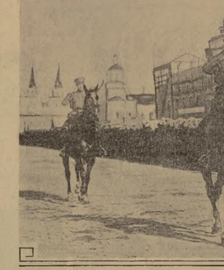
El "camarada" Voroshilov, jefe supremo de los ejércitos de Rusia, pasando revista a la gran parada militar celebrada en Moscú el día primero de este mes, con motivo de celebrarse la Fiesta del Tra bajo.

La excelente organización, dirigida por el popular maestro, interpretará un grupo de selecciones bailables, ejecutadas "a tempo" para amenizar las fiestas caseras.