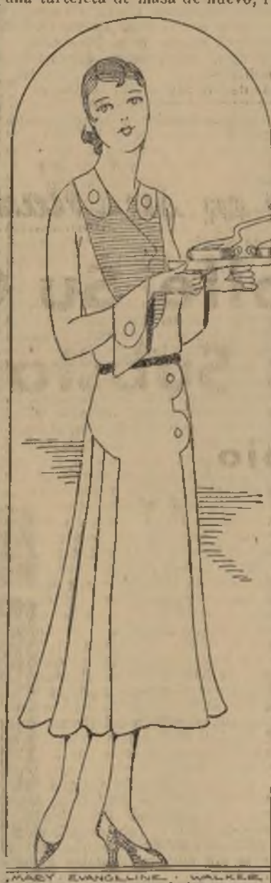
Delicado y encantador vestido de novia

Se ponen a cocer espinacas; cuando están cocidas se ponen a destilar y se pican. Se colocan en una cacerola una cucharada de mantequilla y media de harina; agréguale la leche necesaria para hacer una salsa, en seguida las espinacas, una cucharada de champús secos, pimientos y remojados de antemano, de cucharadas de queso rallado, un hoja de laurel, media taza de nata sal y pimienta. Tener preparada una tarleta de masa de huevo, re-