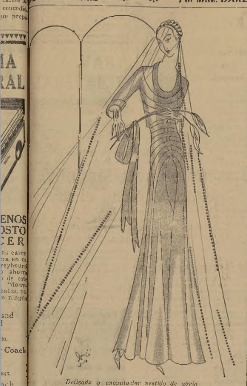
Delicado y encantador vestido de novia