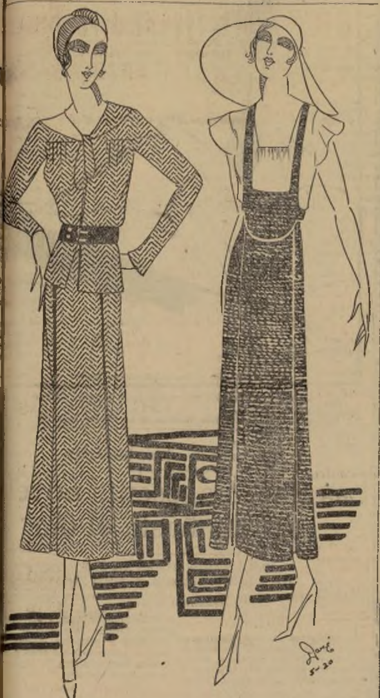
Elegante conjunto para calle en seda azul con puntitos blancos y original vestido

NEW YORK, mayo 19.—Uno de los detalles más importantes en el guardarropa femenino y al cual debe prestarse debida atención, es el calzado. Un zapato de un color que no hace armonía, arruina un atavío que de otro modo resultaría perfectamente elegante. Un calzado que apriete demasiado produce una mala que no puede disimularse y que cualquier momento agrada. Y desentona con el vestido por lindo que éste sea. En mi opinión la economía más tonta que se hace es en el calzado. Es verdad que se ven preciosos modelos, baratas copias de otros de más precio, pero a menos que no sean suaves, cómodos, es mejor tener malos zapatos que malos vestidos. Los zapatos deben escogerse con mucho cuidado, ya sean para casa o para el trabajo. Cabritilla de colores oscuros, tales como el marino, verde o borgoña, son chic hoy como lo fueron siempre. Pero si sus recursos no le permiten armonizar su atavío con zapatos de color, lo mejor es tener un atractivo par negro y otro gris. Este año los modelos de zapatos están de moda. Para caminar cómodos, naturalmente, el oxford, el oxford bajo es el mejor; la zapatera con trabilla es para ocasiones formales, tales como almuerzos