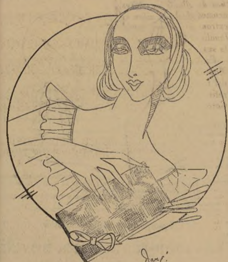
Una mujer elegante deberá tener más de una cartera

NEW YORK, mayo 22.—A la mujer no le agrada una cartera nueva! No importa cuántas posea y cuán variadas, siempre halla sitio para otra más—haciéndola sentirse llena de placer al lucirla. Pues la mujer bonita y elegante sabe que para estar bien vestida debe llevar la cartera del estilo y color que corresponda a su atuendo—y las carteras se encuentran y estacionan fácilmente. Así que una necesidad por varias, pues es algo imprescindible en el tocado femenino. No es necesario que una se desespere con las gaitas y ventosas que, a veces, se necesitan para sujetar un bolso. Solo se necesita ahorrar un poquito, estar pendiente del anuncio de una venta, y comprar uno o tres. Pero la mujer inteligente compra dos o tres que puedan limpiarse con facilidad y que duren.