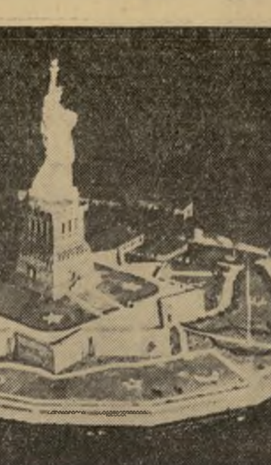
Interesante vista de la estatua de la Libertad de Nueva York, tomada por la noche desde un aeroplano a 1500 pies de elevación. La intensa luz necesaria para tomar la extensa área fotografiada, se debe a las bombas iluminantes, que acaban de ser perfeccionadas por el ejército de la nación.