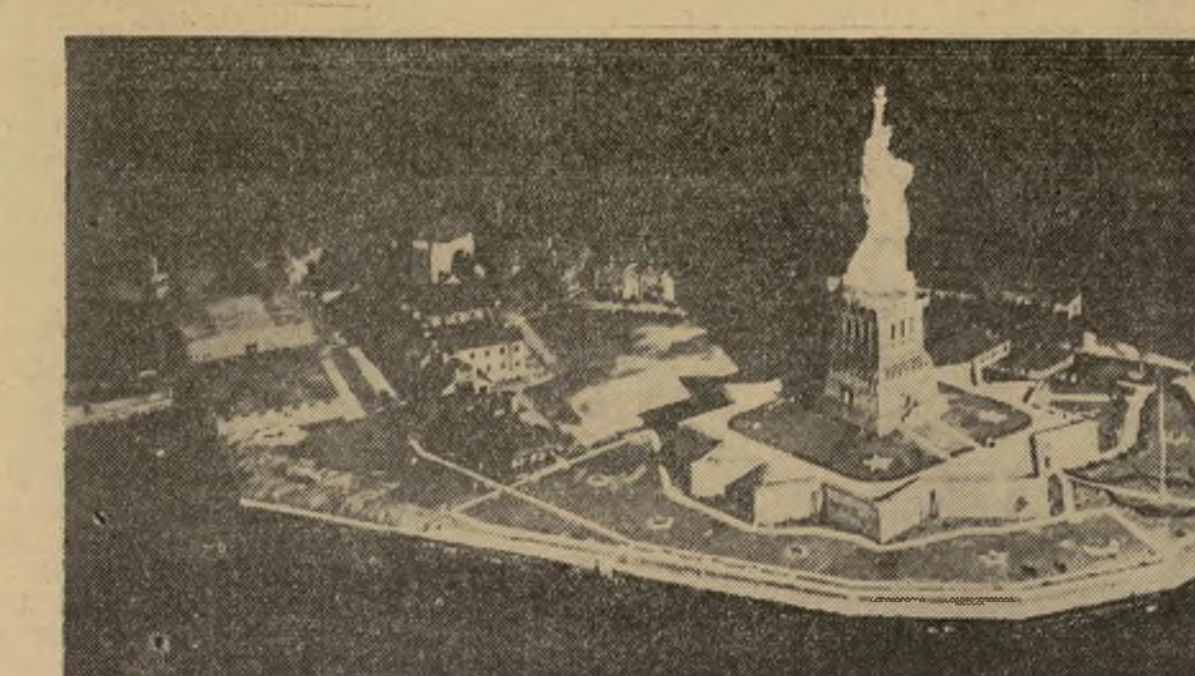
Interesante vista de la estatua de la Libertad de Nueva York, tomada por la noche desde un aeroplano a 1500 pies de elevación. La intensa luz necesaria para tomar la extensa área fotografiada, se debe a las bombas iluminantes, que acaban de ser perfeccionadas por el ejército de la nación.