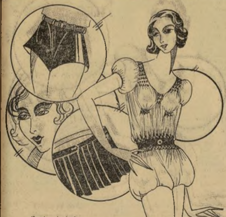
Trajes de baño

NEW YORK, mayo 30.—Si su traje de baño no es chic, seguramente no se divertirá ni pizca, pues una mujer le gusta saber que su indumentaria, de cualquier clase que sea, no está acorde con la última moda. Pero a veces ignora en donde está este chic, el mantenimiento irrefutable a los cambios de estilos en trajes de baño y necesarios que hay en la actualidad. Empecemos por el traje de baño que es la parte más esencial. Puede ser de tela o de una sola pieza con una falda postiza o con blusa por dentro y pantalones cortos por los de los hombres. O puede ser de tela y les dire que éstos se están haciendo muy populares.