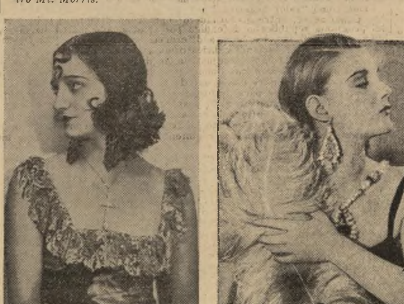
Helen Chandler y Ramón Novarro hacen las delicias del público con la excelente interpretación de "The Daybreak" (La alborada), en el Teatro-Cine Capitol esta semana.