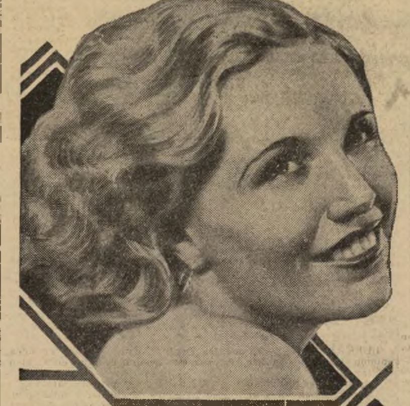
La notable Irene Delvey, protagonista de "Fifty Million Frenchmen" (Cincuenta Millones de Franceses), obra cinematográfica que se ofrece hoy, mañana y el viernes en la pantalla del Teatro Mt. Morris.

Elegante y espacioso comedor. Especialidad: ARROZ CON POLLO, BACALAO A LA VIZCAINA. Table d'hôte 0.85 cts. Jueves y domingos $1. Horario de 6 a 8 p. m.