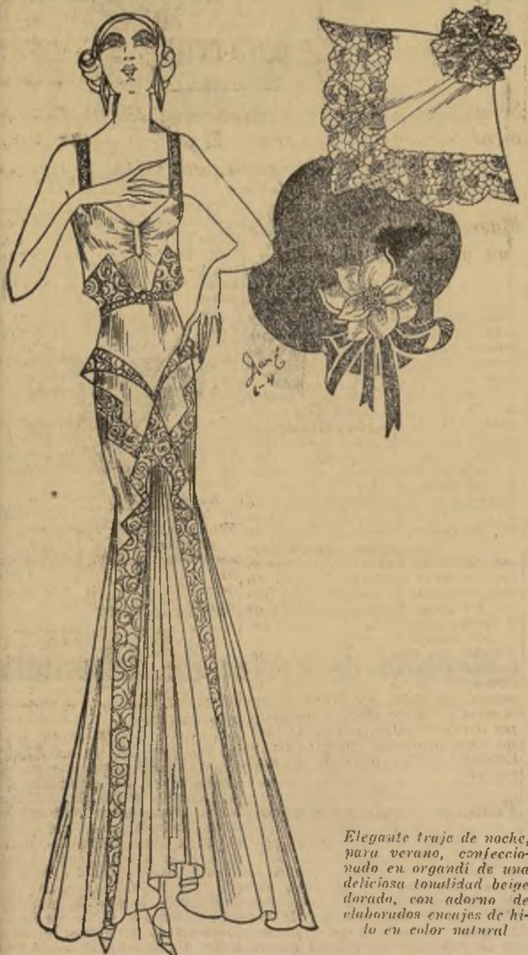
Elegante traje de noche, para verano, confeccionado en organdi de una deliciosa tonalidad beige dorado, con adornos de elaborados encajes de hilo en color natural.

NEW YORK, junio 3.—Oh, vanos todos los mas lejos que podáis! Pero hagamos algo diferente de lo rutinario este año, y llevémoslo en el equipo estrictamente necesario y la ropa correcta para estar cómodas y a la moda.