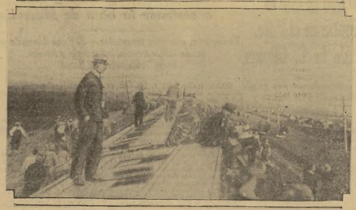
Un grupo de pasajeros del tren rápido denominado "Empire Builder," de la compañía Northern Rail Road, centados y paseándose sobre los vagones que un formidable huracán tumbó recientemente cuando el convoy iba por los alrededores de Fargo, en North Dakota. En la catástrofe resultaron un muerto y veinte heridos.