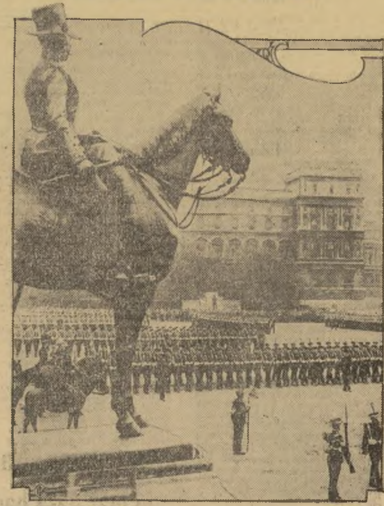
Aparatoso revista de los regimientos de la Guardia Real en Londres, haciendo un desfile de ensayo para las grandes ceremonias que se han de celebrar próximamente el día del cumpleaños del rey Jorge V. Las tropas desfilaron con una precisión cronométrica ante la estatua del general Wesley, que talmente parece que fuera el jefe que verdaderamente las revista.