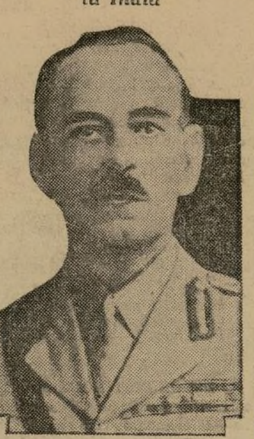
Reciente fotografía del general inglés Philip Chetwode, que acaba de ser nombrado comandante en jefe de las fuerzas británicas en la India y que a su llegada a Bombay fue objeto de un gran recibimiento.