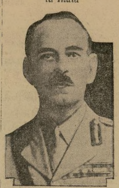
Reciente fotografía del general inglés Philip Chetwode, que acaba de ser nombrado comandante en jefe de las fuerzas británicas en la India y que a su llegada a Bombay fue objeto de un gran recibimiento.

MADRID, diciembre 31. (AP).—El gobierno anuncia que no habrá amnistia ni liberación condicional para los complicados en los últimos sucesos de intento revolucionario, según manifestaron varios de los ministros.