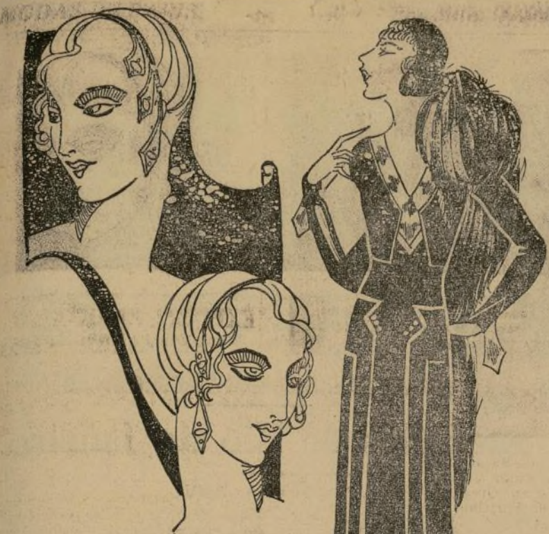
Chic y encantador vestido de calle, en lana azul oscuro y blanca, adornado con raso blanco.

PARIS, 27 de diciembre. —Resoluciones para el Año Nuevo: Que se sea atractiva siempre; que no desfilaremos; que no dejaremos que los caprichos de la moda nos seduzcan; que no nos apropiados para mi tez, figura y personalidad; que estare siempre bien vestida aun cuando no tenga mas que un equipo completo.