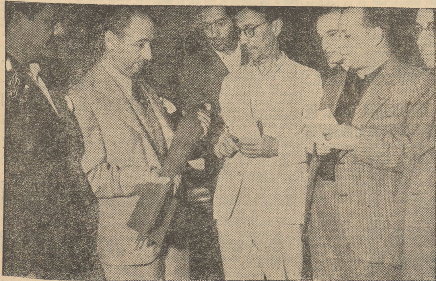
El President Companys mostra als periodistes la primera bomba d'aviació construïda per les indústries de guerra de Barcelona