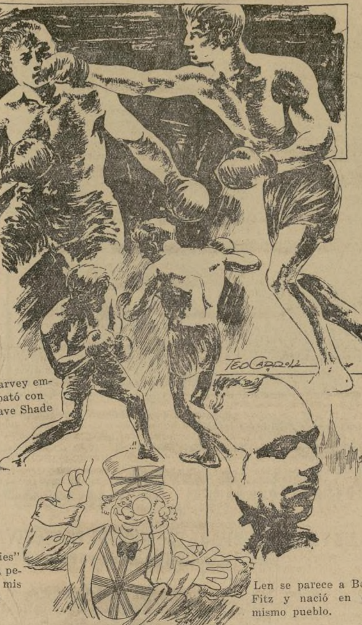
Len se parece a Bob Fitz y nació en el mismo pueblo.