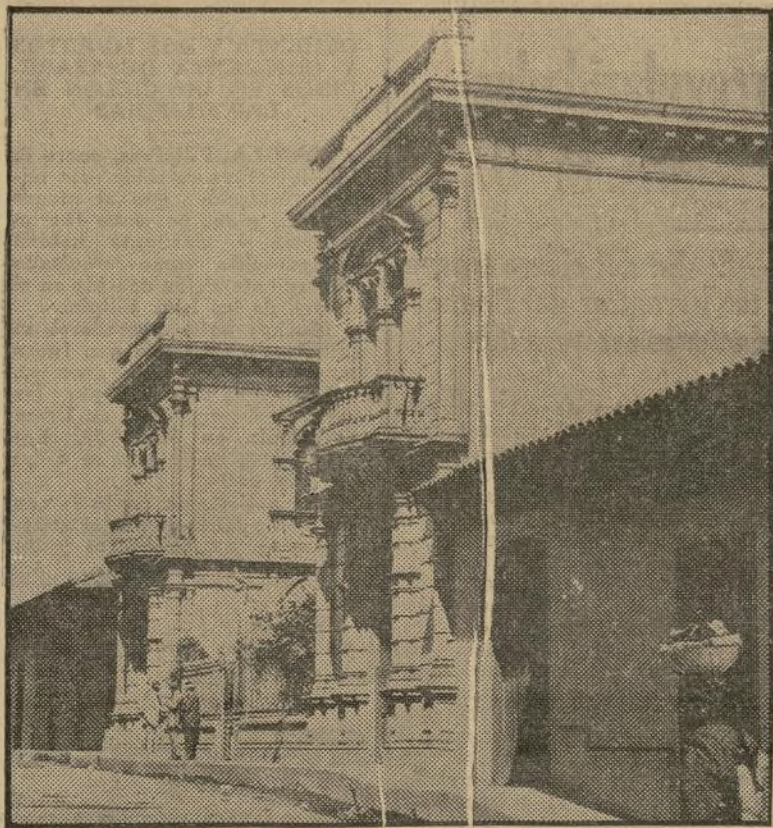
Vista de la legación Norteamericana en Managua la cual está ahora bajo la guardia de los "marines" a raíz del último combate en que perecieron ocho individuos de las fuerzas de los Estados Unidos que se encuentran en aquel país.