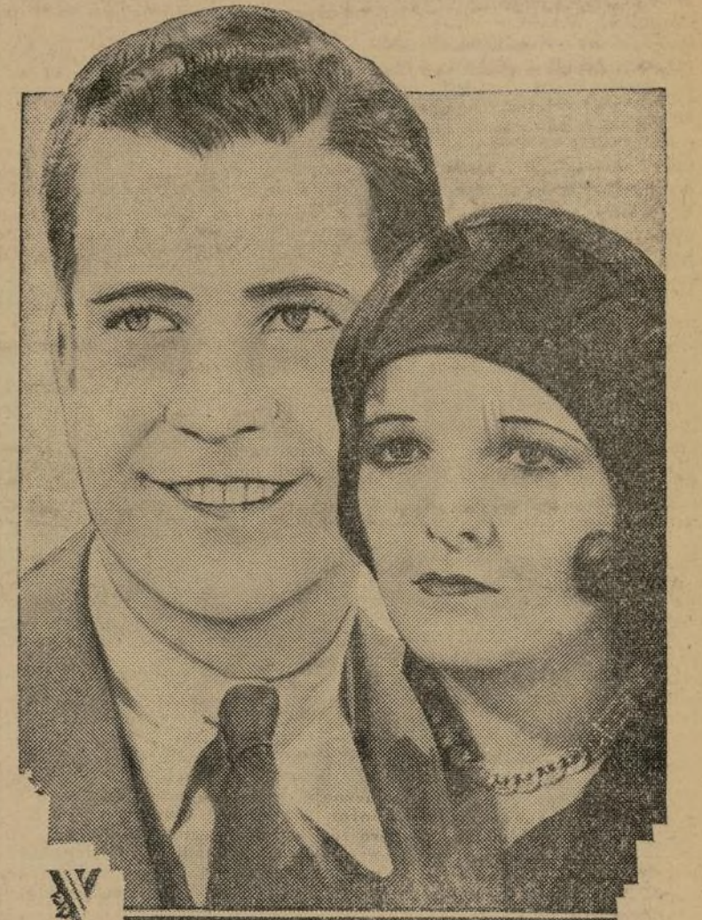
Grant Withers y Marian Nixon, intérpretes de "Scarlet Pages", que pasa al "Regent" esta noche para permanecer hasta el viernes.

Lupe Vélez se presentará en el "San José" el próximo viernes en la cinta toda hablada en español "Oriente y Occidente."