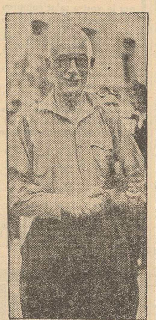
El comandant Salavera, en iniciar-se el moviment subversiu dels militars traidors a Barcelona, es presentava a la Conselleria de Governació a les 8 del matí amb dues campanyes d'indignitat per a defensar la República i, després lluitant a la plaça de Catalunya i a altres indrets. Actualment mana una columna al front aragonès i ha obtingut amb ells importants victòries sobre els rebels