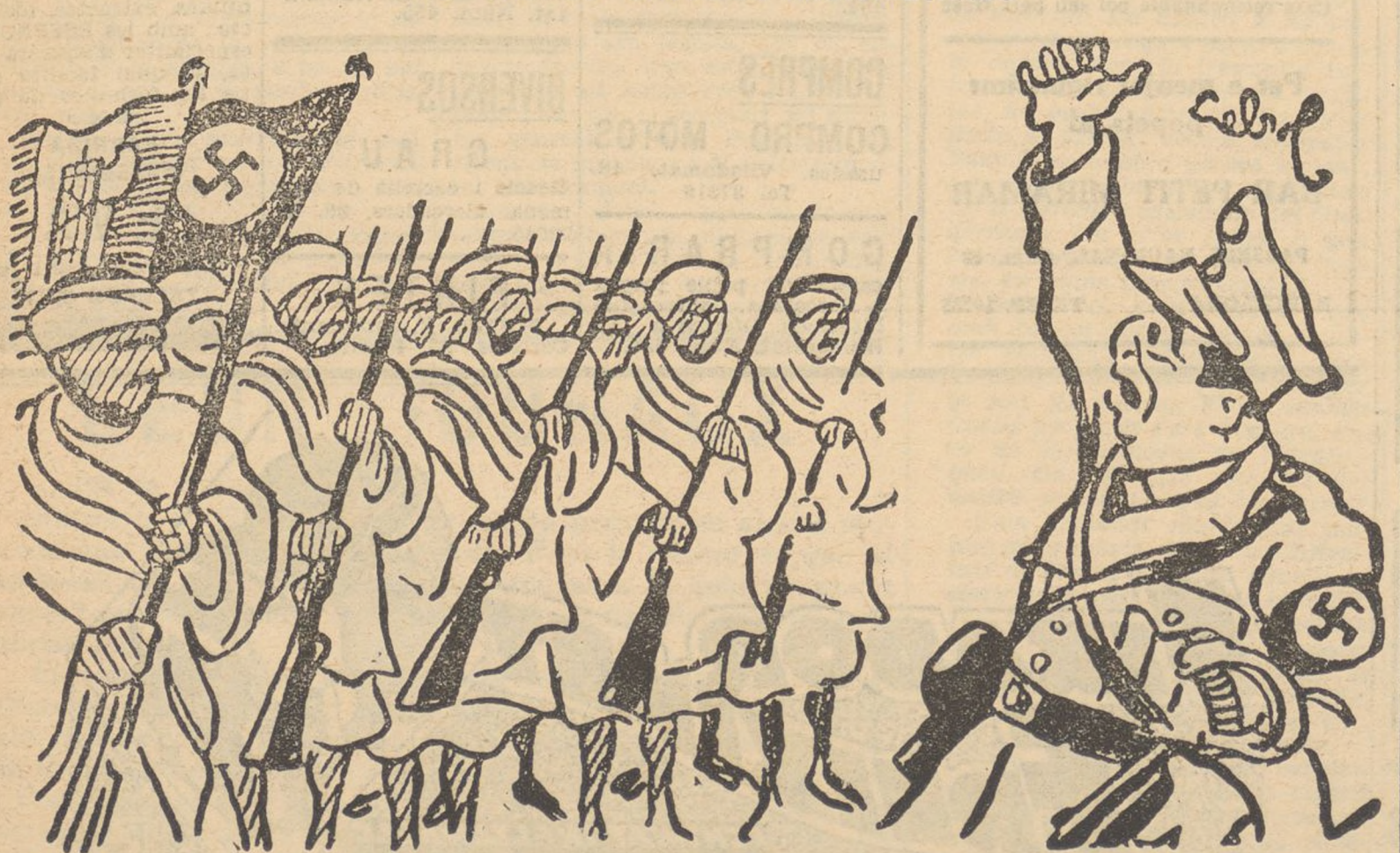
FRANCO: Avant!... al crit de «Espanya per als espanyols».