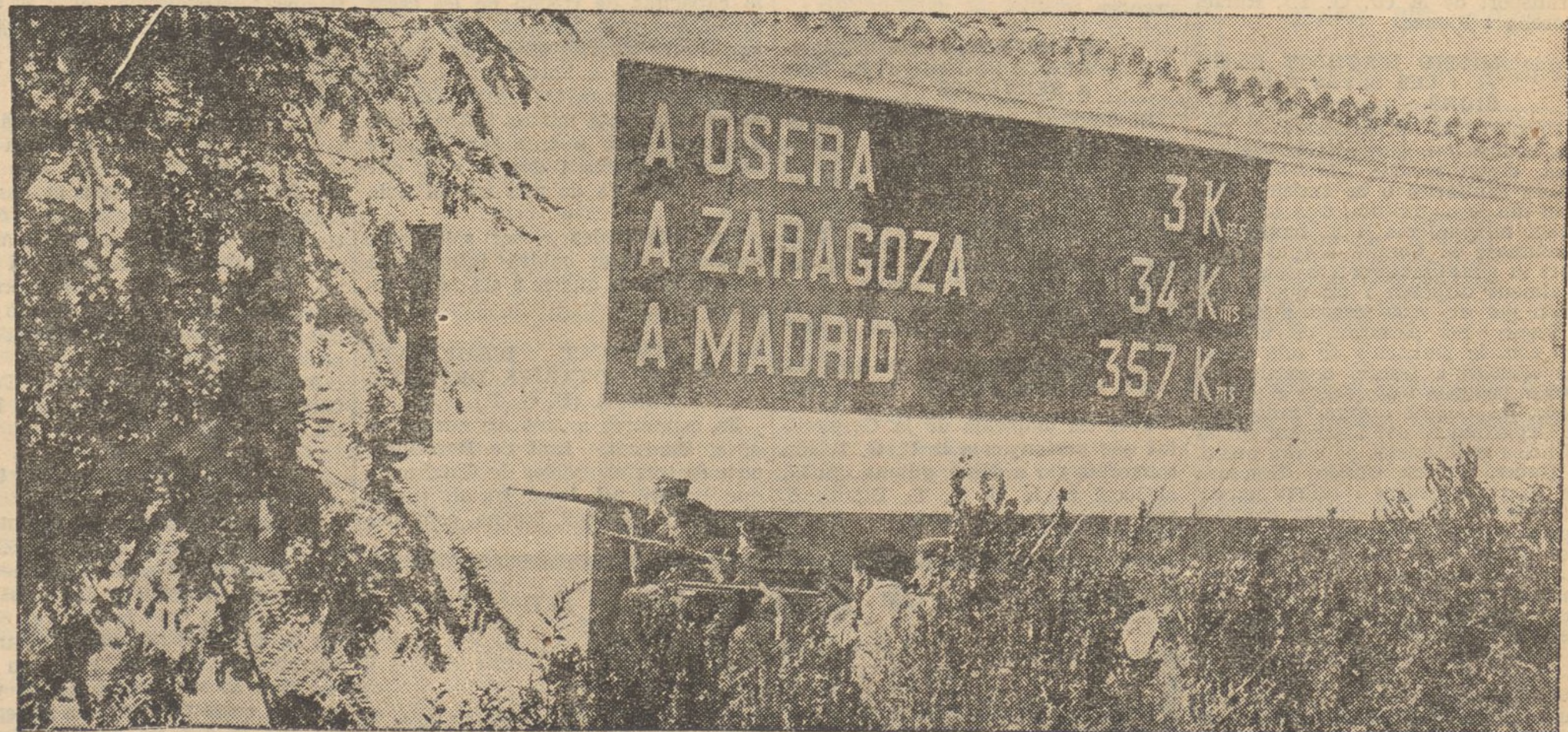
A la carretera general de Barcelona a Madrid, per Saragossa, com en altres llocs, en una caseta de peons caminers hi ha un rètol indicador de distàncies. A Saragossa, diu, 34 quilòmetres. La distància que separa, en aquests moments, les nostres avançades i el fort de les nostres columnes, és molt inferior. Quantes, però, no han estat i seran encara les vicissituds i fadigues que hauran de sofrir els nostres valents milicians per a foragitar d'allí aquell sanguinari general facciós Cabanellas. Els valents milicians no defalleixen. Avant! Per la victòria!