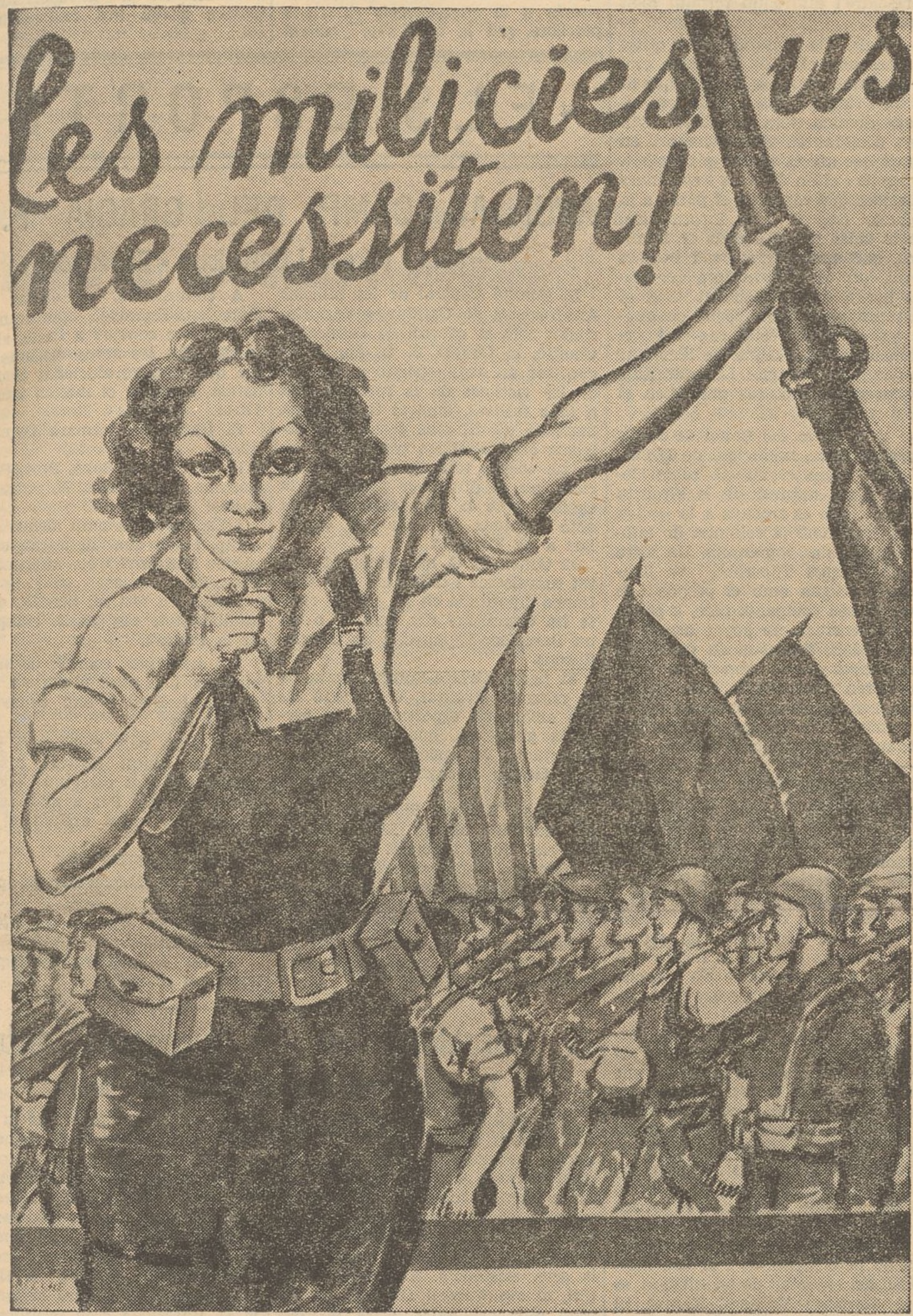
Suggestiu cartell de mobilització que acaba d'ésser fixat pels carrers de les ciutats i pobles de Catalunya. El pasquí és obra del nostre company Artoche