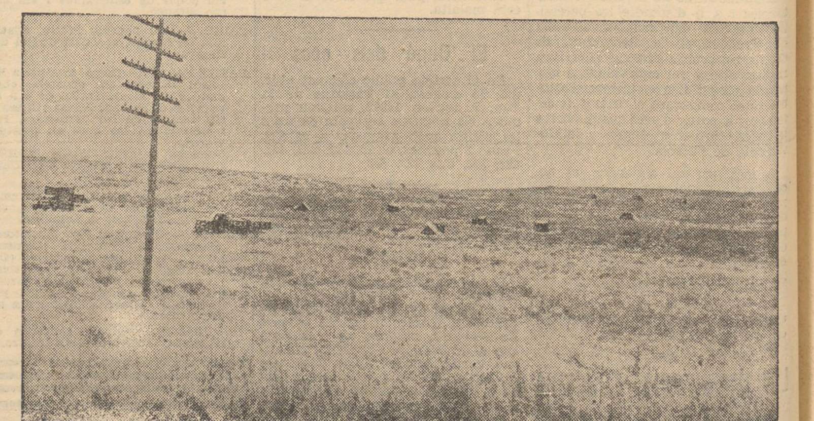
La vida a la campanya no està pas sobrada de comoditats. Amb tot, els nostres braus milicians procuren situar-se en bones condicions, dins les poques possibilitats que hi ha de fer-ho. El campament del front aragonès que es veu a la foto, és una mostra de com han procurat enyagar-se els nostres combatents per a aixopugar-se en 168 hores de lleure