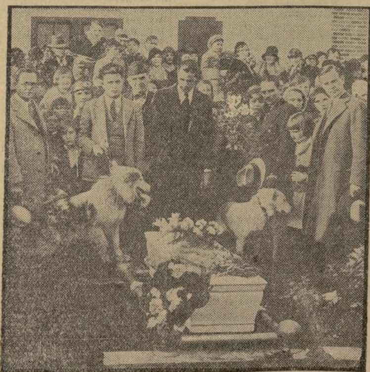
Entierro del famoso perro "Unalaska", que prestó grandes servicios a la expedición antártica del almirante Byrd. El noble animal aparece encerrado en una caja blanca, rodeado de numerosos niños de escuelas y de dos perros más, que fueron también con el almirante Byrd en la expedición antártica. El entierro se verificó en la ciudad de Monroe, en Louisiana.