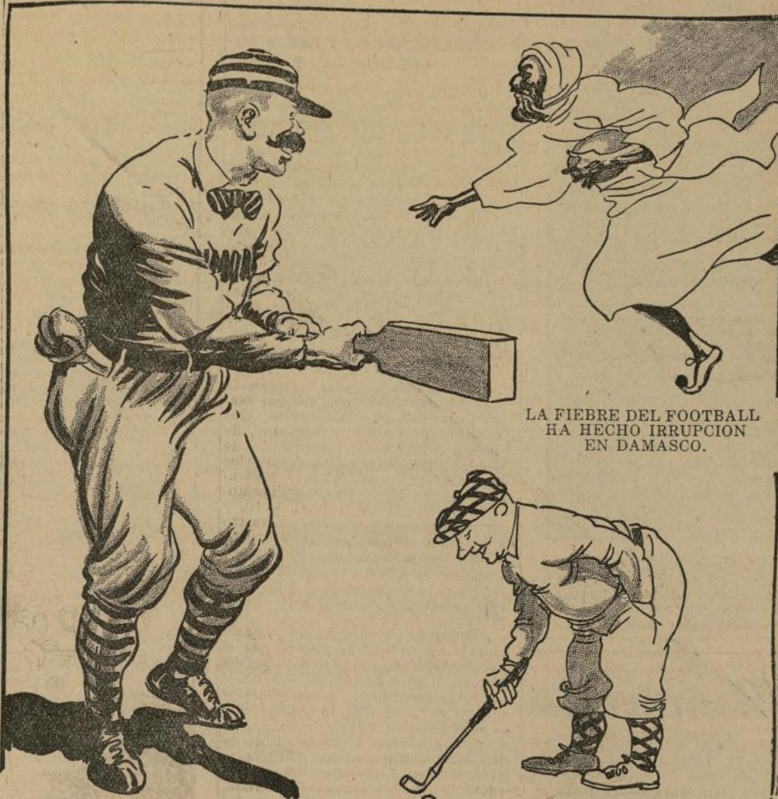
LA FIEBRE DEL FOOTBALL HA HECHO IRUPCIÓN EN DAMASCO.

¿SABE UD. QUE HASTA 1880 LOS BATEADORES PODIAN USAR BATES CUADRADOS?