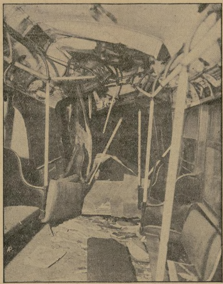
Interior del vagón que con más violencia se estrelló contra las columnas.

"El sueño de una federación de la India se ha convertido en realidad inmediata"