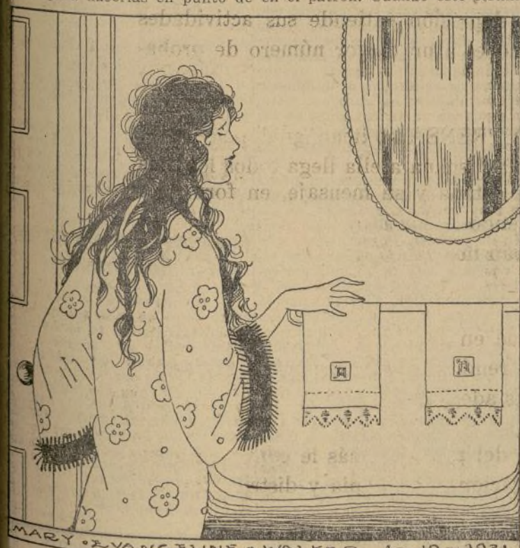
Las antiguas iniciales inglesas son aún adorno muy apreciado

Antiguo alfabeto inglés. Las primeras a diseñar son las iniciales inglesas. Son de gran utilidad para hacerlas en punto de